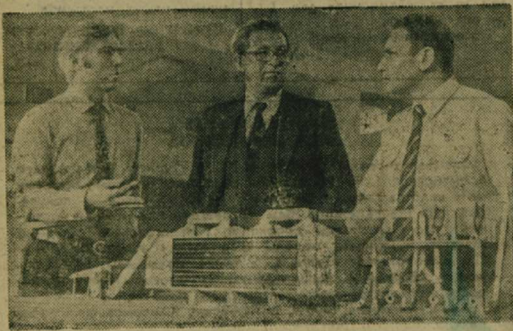
Киев. Промышленная переработка фруктов в нашей стране ежегодно дает около 3,5 миллионов тонн выжимки. Богатые многими ценными для человеческого организма веществами (пектином, например), они служат исходным сырьем для получения фруктового порошка — пищевого заменителя сахара. Кондитерская про-