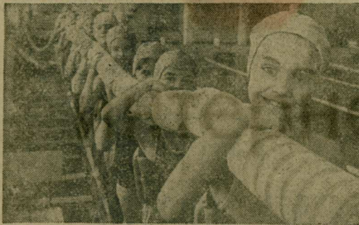
Ребята. Учащиеся младших классов школ города учатся плавать в спортивном комплексе «Чайка». Бассейн оснащен всем необходимым оборудованием. Занятия проводятся под руководством опытных тренеров и под наблюдением медицинского персонала. НА СНИМКЕ: мы учимся плавать.