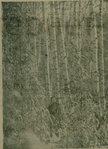
В зимнем лесу.