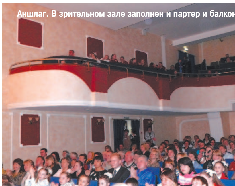
Аншлаг. В зрительном зале заполнен и партер и балкон