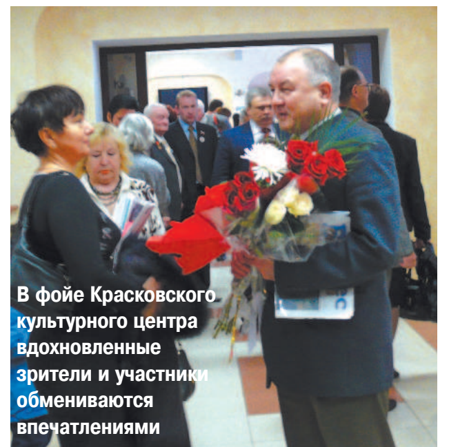
В фойе Красковского культурного центра вдохновленные зрители и участники обмениваются впечатлениями