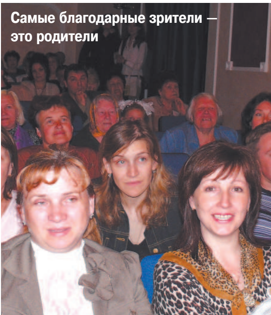
Самые благодарные зрители — это родители