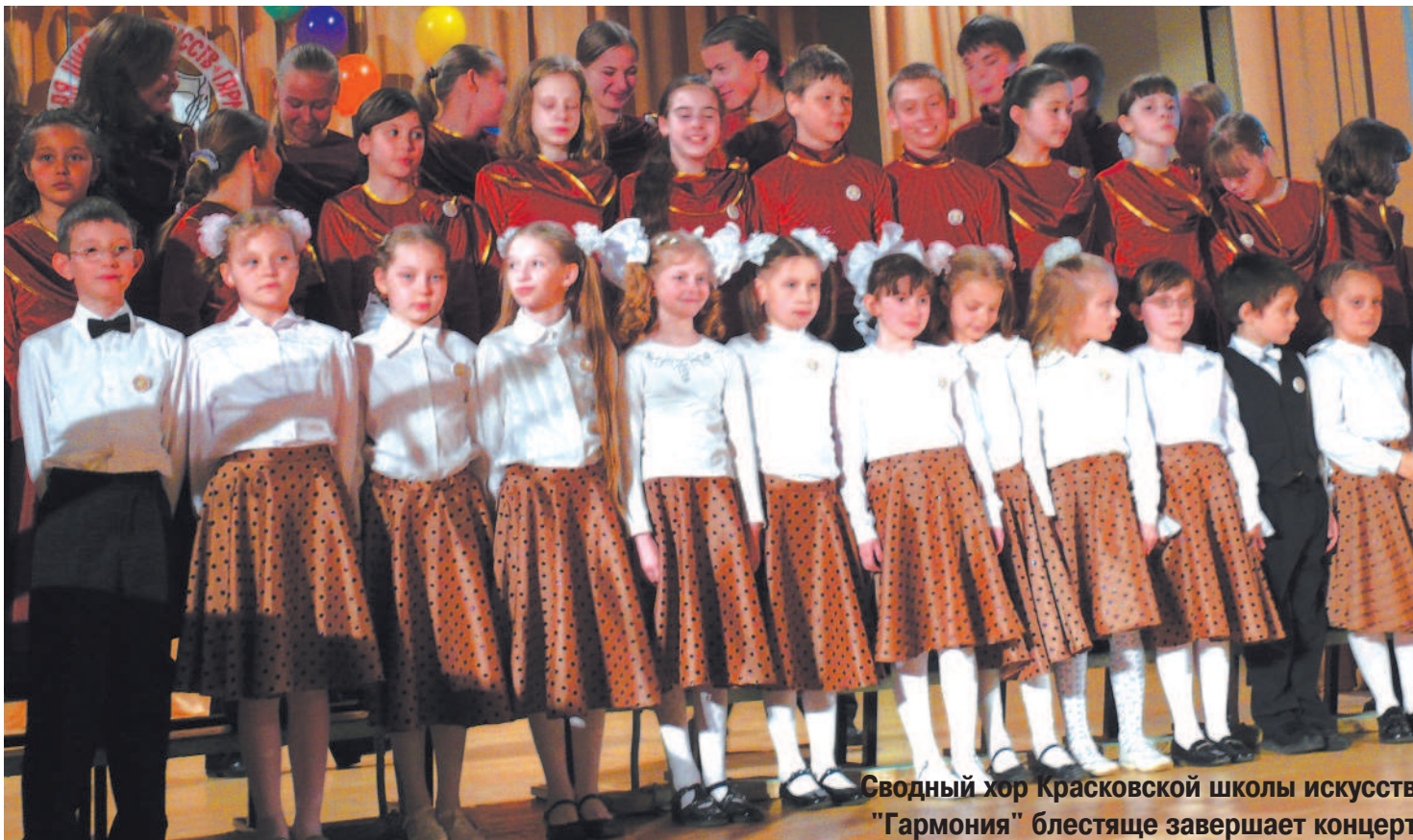
Сводный хор Красковской школы искусств "Гармония" блестяще завершает концерт