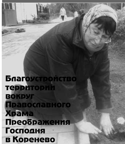
Благоустройство территории вокруг Православного Храма Преображения Господня в Коренево

Владелец этого автомобиля определил место для ежедневной стоянки ближайший газон во дворе домов. Вечером к нему присоединяются еще несколько, хотя в двадцати метрах есть организованная стоянка. Удивляет абсолютное равнодушие жителей. А может лучше посадить здесь цветы?