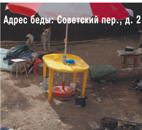
Адрес беды: Советский пер., д. 2