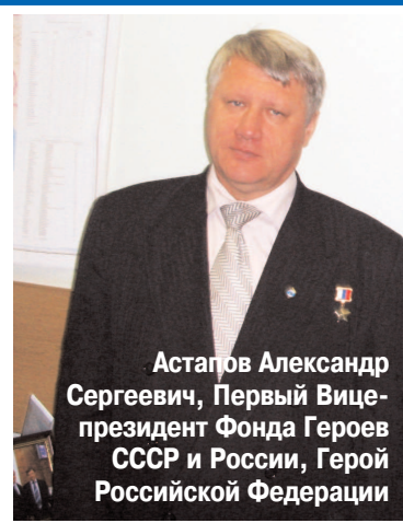
Асташев Александр Сергеевич, Первый Вице-президент Фонда Героев СССР и России, Герой Российской Федерации