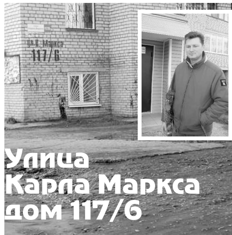
Улица Карла Маркса дом 117/6