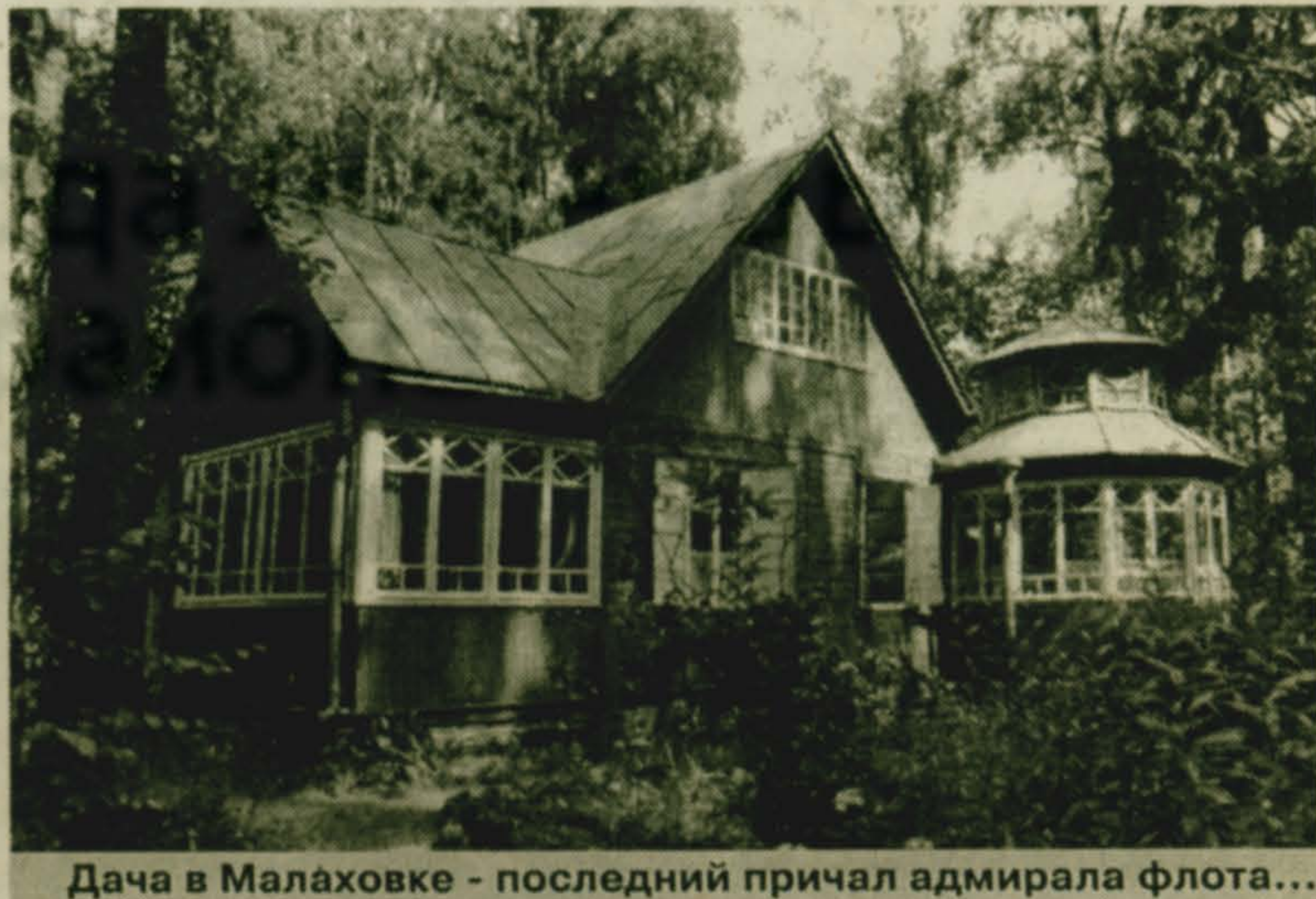
Дача в Малаховке - последний причал адмирала флота...

Кажется, в потоке тотальной компьютеризации нашего интеллекта мы, наконец-то, начинаем понимать, что культура - это не только наше образование, но и наше воспитание, прежде всего, которым, к сожалению, никак не можем похвалиться мы сегодня.