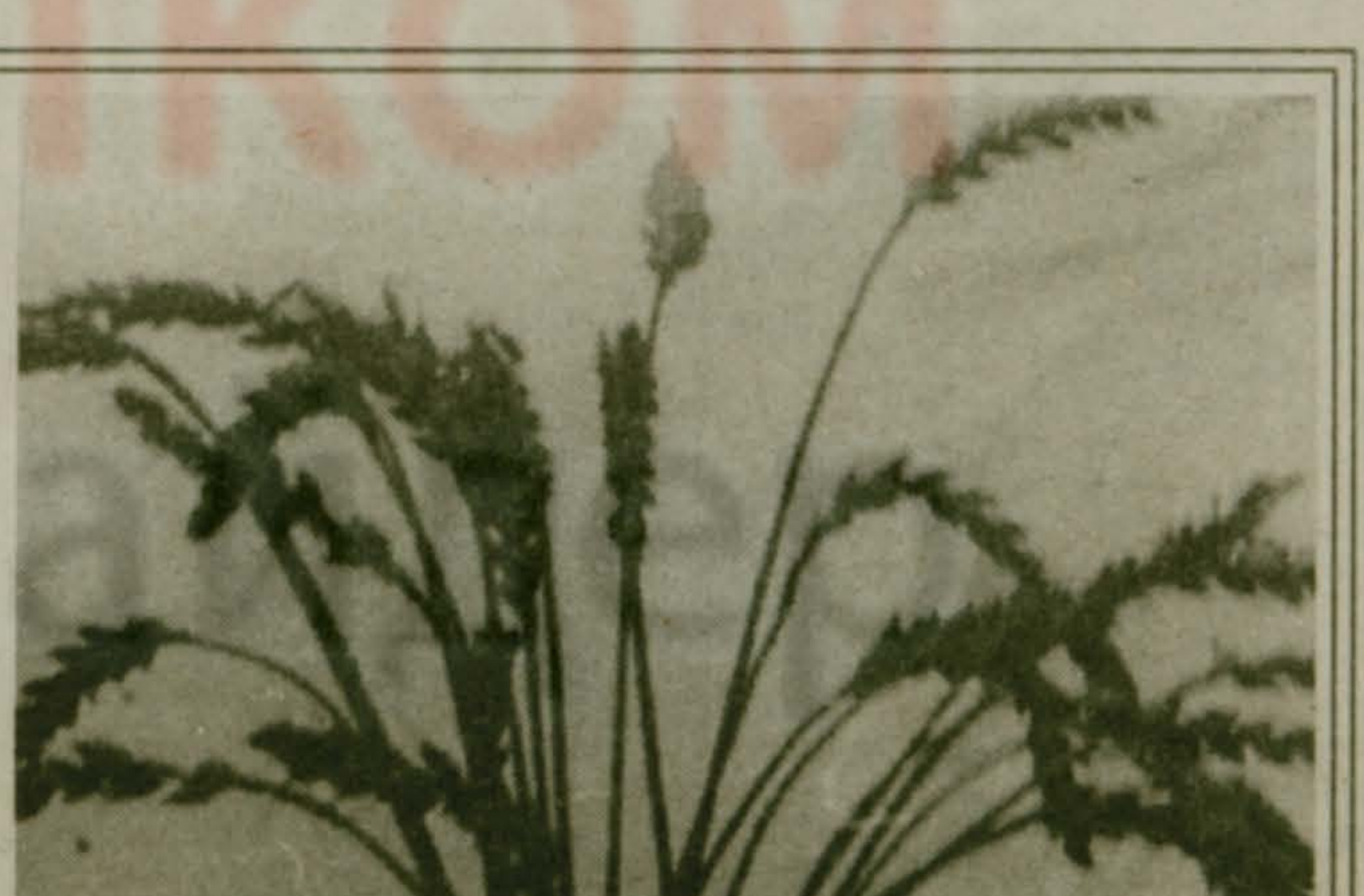
Выпуск подготовил Петр БИЦУКОВ Шеф-редактор Олег БУЗУЛУК