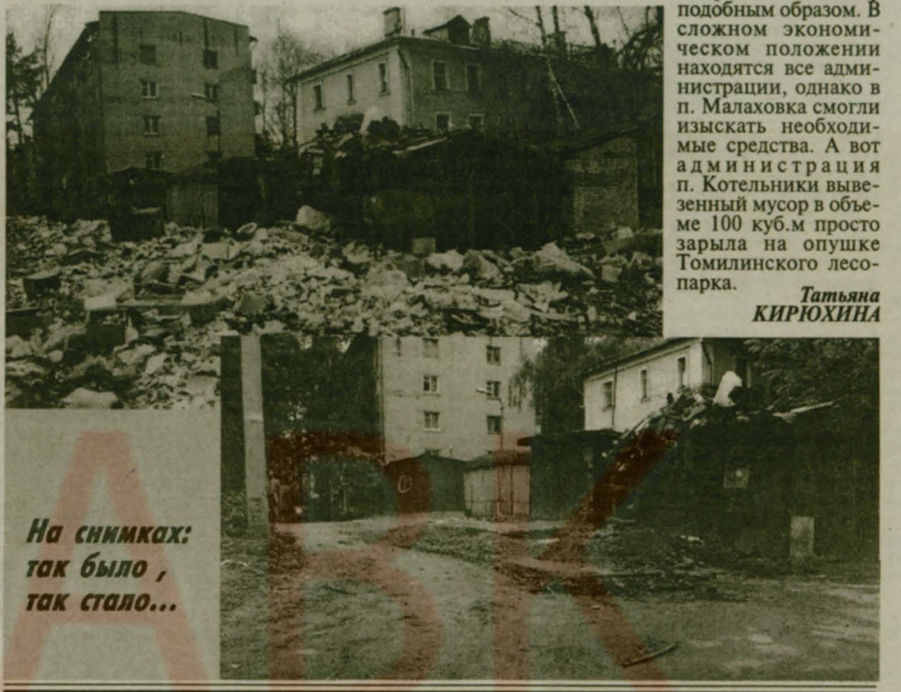
На снимках: так было, так стало...