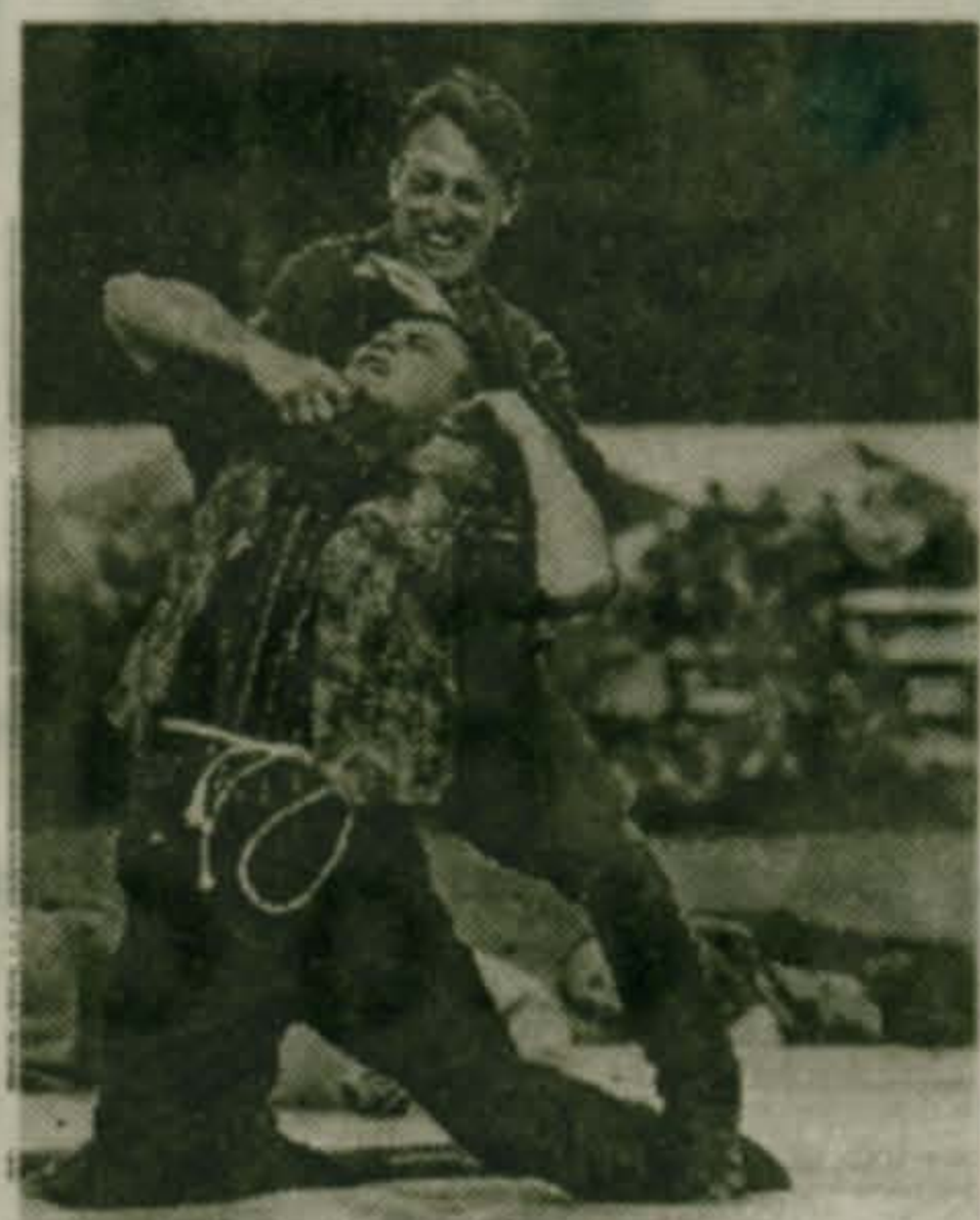
Фото Наталии Плясовой

Пресс-служба Люберецкого УВД, Пресс-служба администрации Люберецкого района.