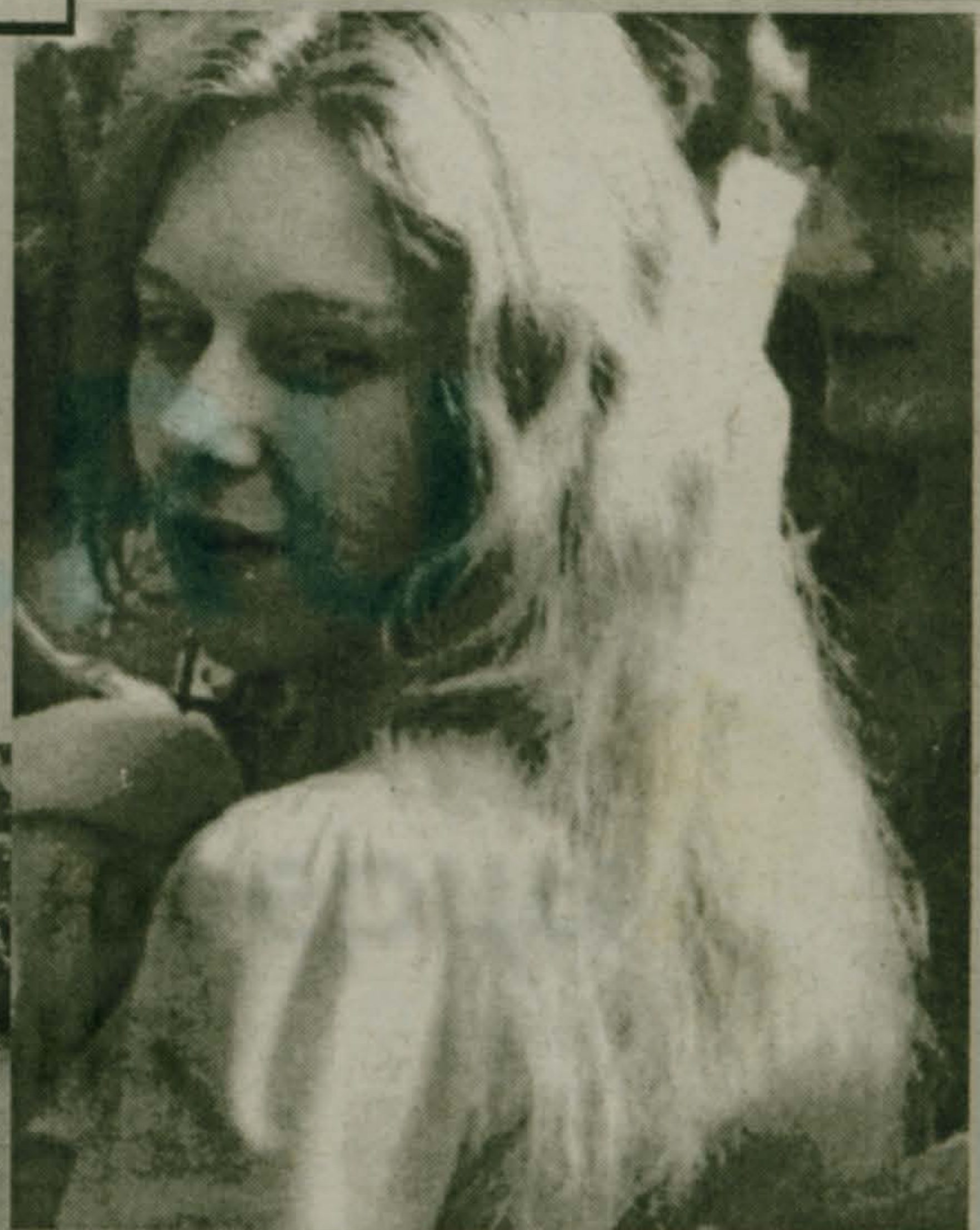
На снимках: прекрасная незнакомка; поднять паруса!