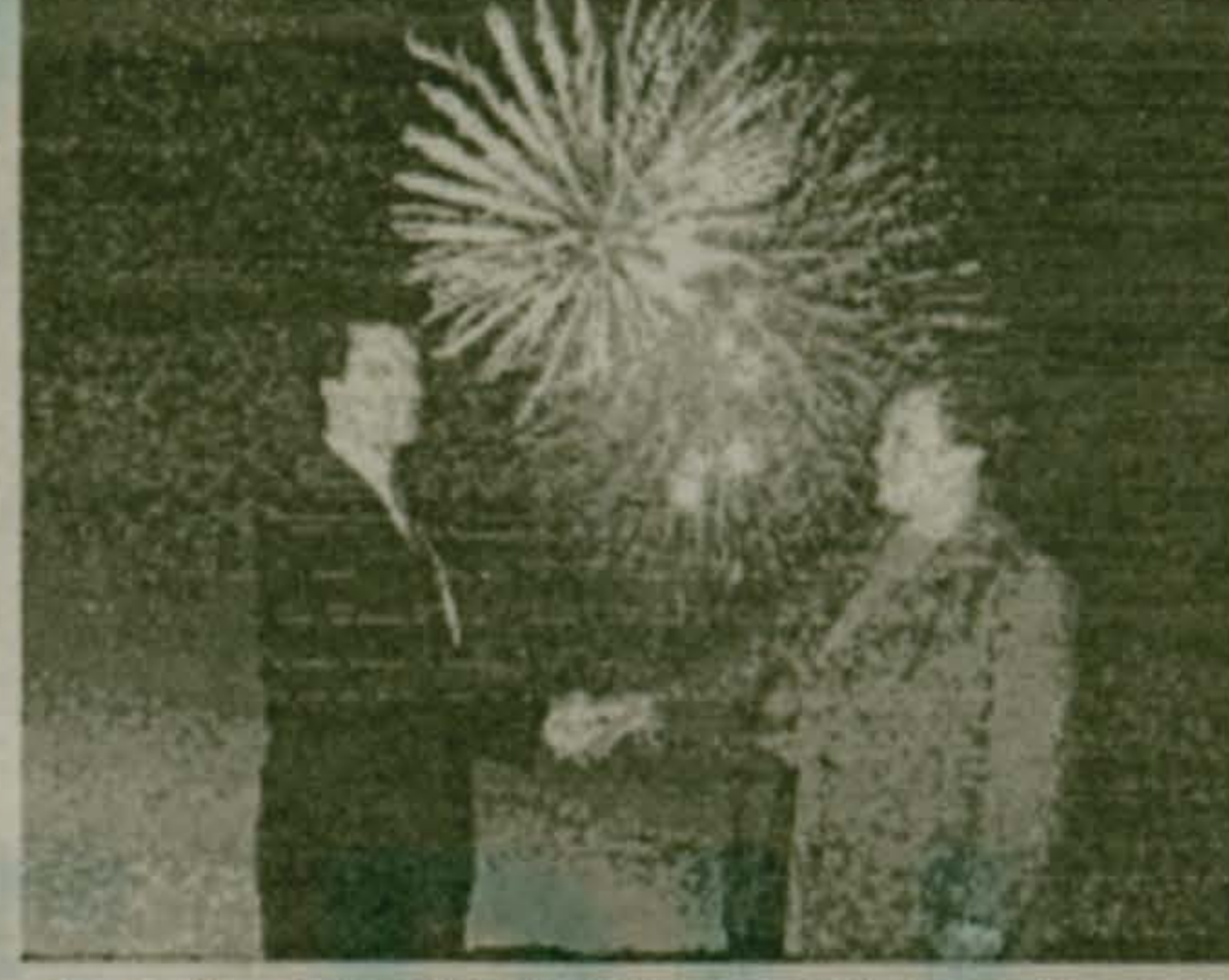
Генеральный директор МГТС... Высота МГТС...

Вышел в свет первый номер газеты "Алло!". Ее учредителями стали крупнейшие российские компании-операторы связи - "Ростелеком", МГТС, Центральный телеграф, "Московский межгородный и международный телефон".