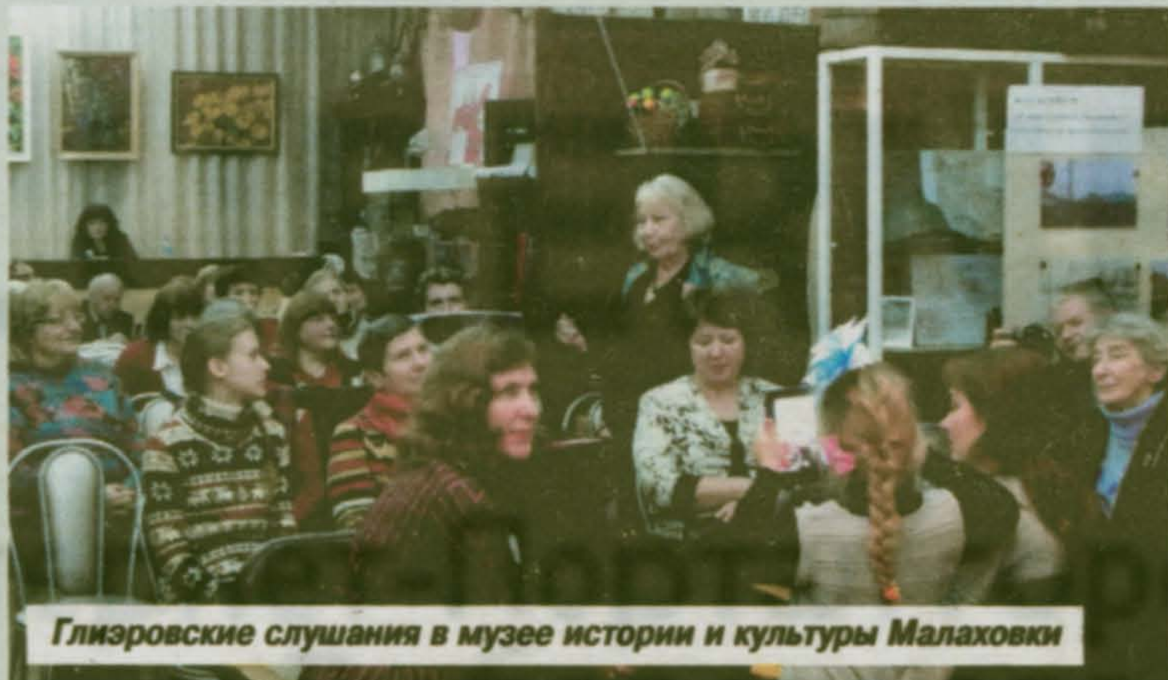
Глиэровские слушания в музее истории и культуры Малаховки