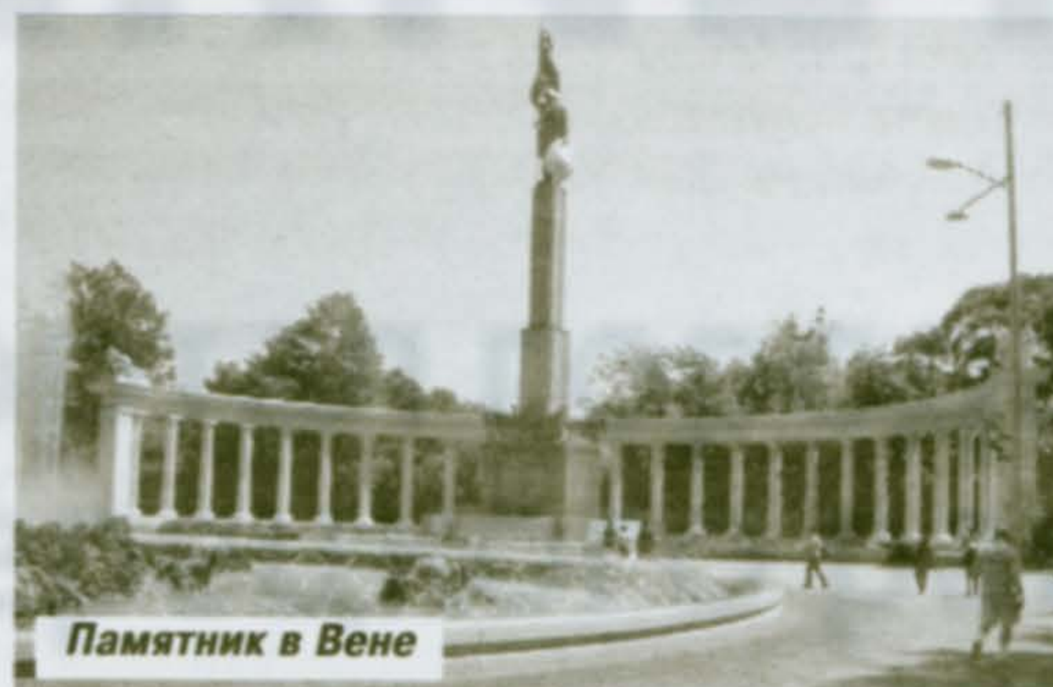
Памятник в Вене

«Помнит Вена, помнят Альпы и Дунай Тот цветущий и поющий яркий май»