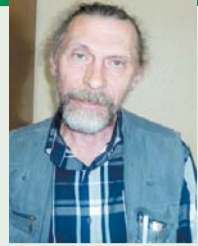
Рубрику ведет Виктор Антонов

Что же это за образ жизни такой, что имела в виду Мария Владимировна? Это и «сиреневые» балы в парке Летнего театра с неизменной лотереей аллегри, с духовым оркестром, скетинг-ринком и всеми делами. Но это и благотворительные спектакли летней антрепризы в пользу учащихся Красково-Малаховской гимназии (кстати, первой в России сельской гимназии для детей обоего пола). А строили ту гимназию над оврагом вкладчину: все члены Попечительского совета (довольно многочисленного) вносили свой весомый вклад, общины трех смежных уездов участвовали в финансировании проекта, железная дорога (благо, что была в руках акционерных обществ) стройматериалы на эту «стройку века» доставляла бесплатно. Сравните с нынешним перманентным ростом тарифов в РЖД, почувствуйте разницу... А еще ведь и расписание пассажирского паровичка Москва-Раменское приурочено было к началу и окончанию занятий в этой самой гимназии. Все это - вместе с дренажными канавками вдоль всех проселочных дорог, с клубами у железнодорожных станций, с фруктовыми садами и чистыми лесопарковыми зонами, с людьми, заряженными на благоустройство своего дачного поселения - и составляло «малаховский образ жизни».