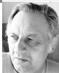
Рубрику ведет Сергей Иванников

Здание, пока ещё числящееся по адресу ул. Южная, 1, внешне напоминает тип строений, получивших в народе название «сталинский барак», но это сходство является обманчивым. В заблуждение вводит зелёная обшивка дома, но в действительности этот дом имеет значительно более длинную историю и к числу барачков никоим образом не относится.