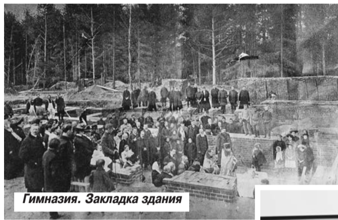
Гимназия. Закладка здания