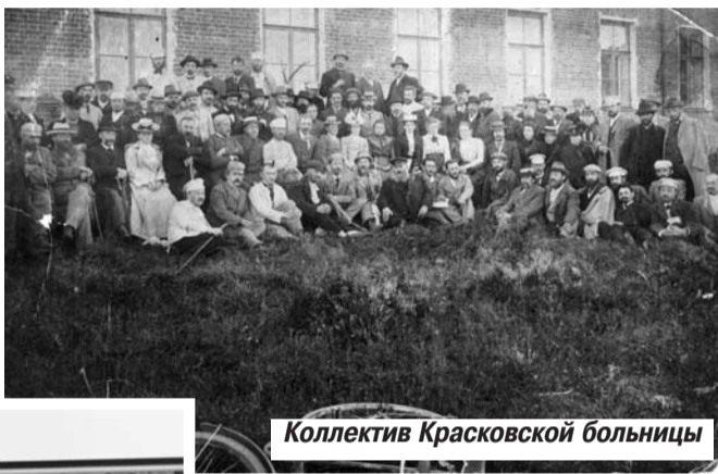
Коллектив Красковской больницы