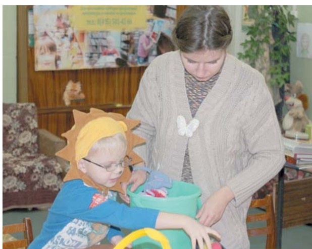
Мама - первое слово, Главное слово в каждой судьбе.