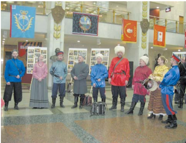
Делегация представителей малаховской общности тоже была приглашена на это торжество. А

21 ноября 2013 года состоялся финал конкурса фото- и художественных работ, посвященных казакам, проживающим и работающим в московском регионе. Конкурс проводился по инициативе и при поддержке Комитета по делам казачества и правительства г.Москвы. Работы финалистов выставки «Казачьи Москвы» представлены были в Центральном музее Великой Отечественной войны на Поклонной горе.