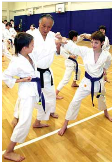
Делай вот так!

– Со мной приехали мальчик девяти лет и три молоденькие девушки. Все уже хорошие бойцы. Только не надо воспринимать их как непобедимых: среди вас есть не хуже. Турнир покажет победителя! А еще со мной приехали двое опытных наставников. Они сегодня помогут мне провести урок... Мне почти семьдесят лет, один из моих товарищей тоже уже дедушка, другой – немного моложе. В каратэ возраст – не самое важное. И я должен был дожить до седины, чтобы понять: истинное понимание техники каратэ приходит к человеку тогда, когда физическая сила начинает его покидать. Можно быть отлично развитым юношей-атлетом – и ничего не знать о своем теле. В этом случае на татами тебя запросто одолеет такой старик, как