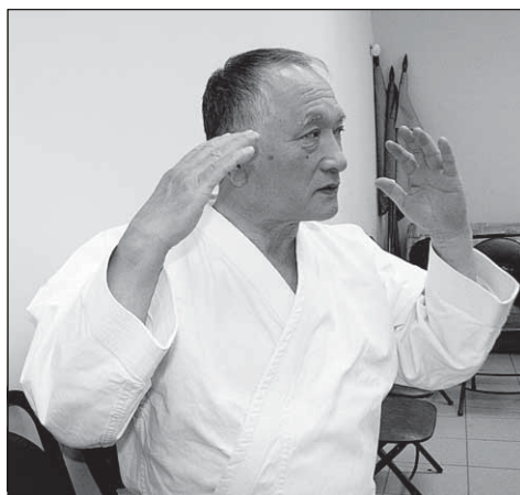
Россия – это вот такое огромное сердце!