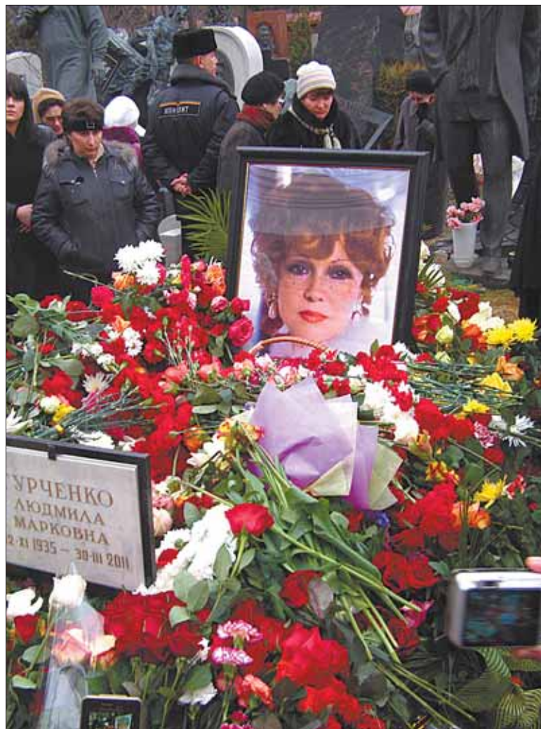
Могила актрисы на Новодевичьем кладбище в Москве

Богдан КОЛЕСНИКОВ Фото автора и из архива