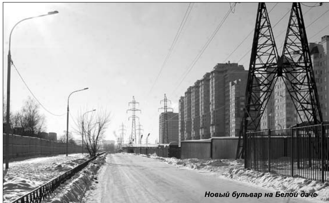
Новый бульвар на Белой даче

низаций, осуществляющих эксплуатацию жилищного фонда, сегодня в Котельниках уже проживает и пользуется коммунальными услугами, а значит, и транспортом, и поликлиникой, и прочими объектами социальной сферы более 25 тыс. человек. Эта цифра не учитывает того населения, которое заселилось в дома-новостройки и не успело оформить права собственности на жилье, а это еще около 10 тыс. человек. Расчет же расходов бюджета на социальные нужды, уборку территории, благоустройство и т.д. по-прежнему ведется областью исходя из официальных статистических данных. Увеличение численности незарегистрированного населения создает дополнительную нагрузку на объекты социальной инфраструктуры: поликлиники, школы, детские сады, транспорт, органы УВД.