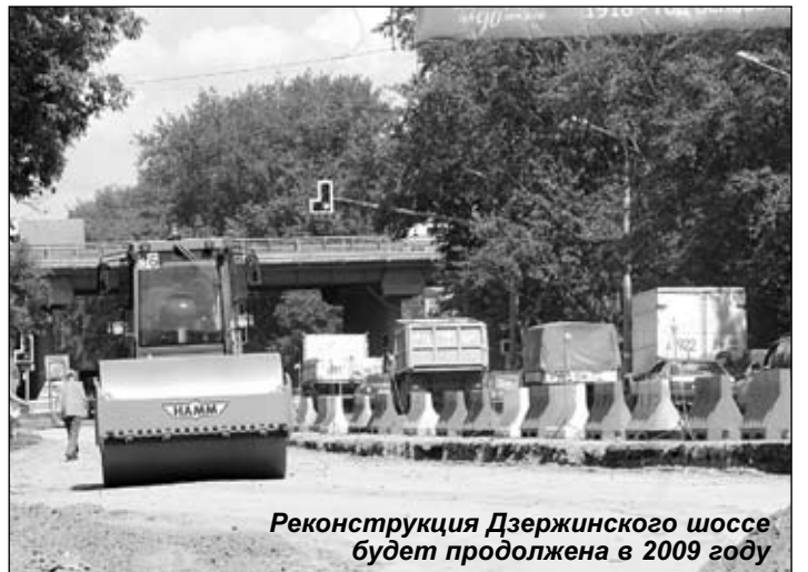
Реконструкция Дзержинского шоссе будет продолжена в 2009 году

Я хочу, чтобы все жители города понимали: то, что мы делаем сейчас в части водоснабжения города, должно решить проблему не на год или два, а как минимум на несколько десятилетий. И никакие экспресс-меры, дающие сиюминутный непродолжительный эффект, в данном случае не приемлемы. Только кропотливая, упорная работа. И долговременный результат!