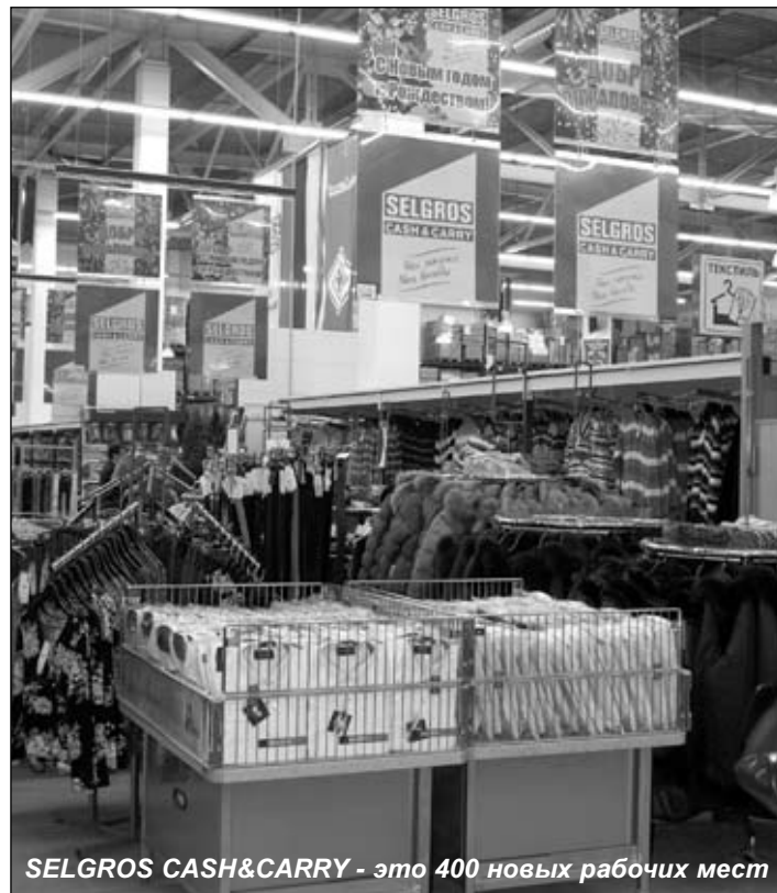
SELGROS CASH&CARRY - это 400 новых рабочих мест

Да, в связи с кризисом проблема трудоустройства граждан приобретает первостепенное значение, недаром этой проблеме уделяется столько внимания и на государственном уровне, и на уровне субъекта Федерации. Что же касается непосредственно нашего города, то несколько лет скрупулезной работы по привлечению в город новых фирм и предприя-