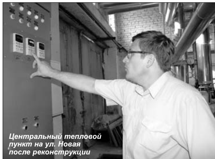
Центральный тепловой пункт на ул. Новая после реконструкции

- Сегодня в городском округе действует около двух десятков маршрутов: и до московских станций метро «Кузьминки», «Рязанский проспект», «Выхино», «Люблино», и до станции Люберцы, и до других городов Подмосковья: Лыткарино, Железнодорожного. И, тем не менее, вопрос пассажироперевозок не сходит с повестки дня. Уже не один раз мы обращались в Министерство транспорта Московской области, выходили на Правительство Москвы с просьбой открыть дополнительные маршруты и увеличить количество транспорт-