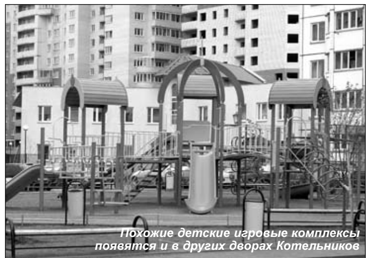
Похожие детские игровые комплексы появятся и в других дворах Котельников

Первоочередные вопросы для нас - развитие городской инженерной инфраструктуры, строительство КНС, замена теплотрасс. Будем ремонтировать стояки, магистральные трубопроводы холодного и горячего водоснаб-