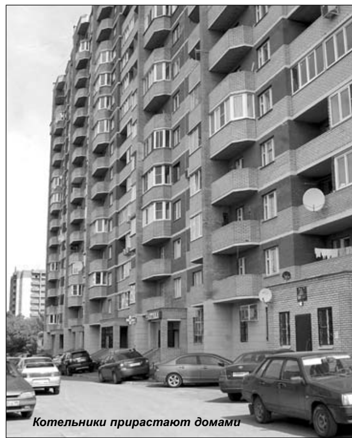
Котельники прирастают домами

- Если говорить о том, что на виду, то, конечно, проблемы начинаются с инвесторов, которые не соблюдают принятых обязательств, не укладываются в сроки, в которые дома, согласно договорам, должны быть построены. Не последнюю роль в этой проблеме играет человеческий фактор: люди вселяются в построенные квартиры задолго до того, как они приняты госкомиссией. Немало пробелов и в нашем законодательстве. Удлиняют срок оформления документов и бюрократические проволочки.