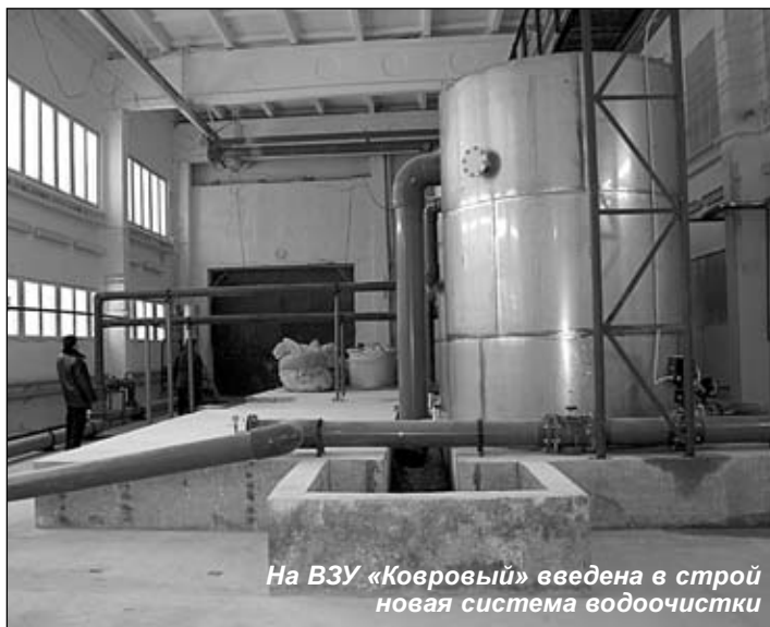
На ВЗУ «Ковровый» введена в строй новая система водоочистки

вечало бы условиям именно нашего города.