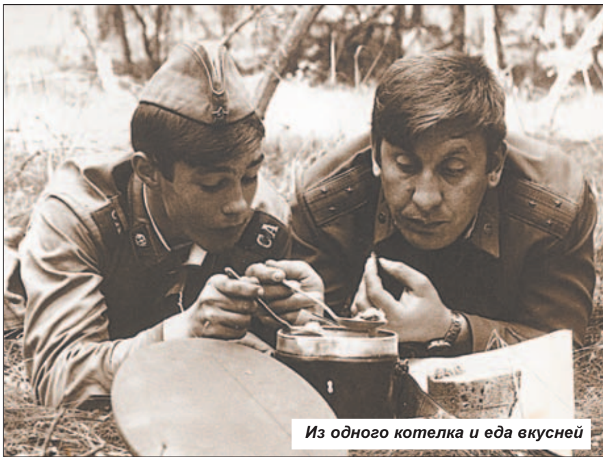
Из одного котелка и еда вкусней

За те 10 лет, что наши войска находились в Афгане, погибло свыше 15 тысяч человек. Думаю, эта цифра могла быть намного больше, если бы не четкие, слаженные действия наших дипломатов, органов КГБ, ГРУ, армейской разведки. Могли привести такой пример. Однажды вывели нас по тревоге, приказали прибыть в аэропорт Кабула. Стоим в оцеплении, смотрим, а по трапу самолета собственной персоной спускается наш «враг № 1» - Губельдин-Хекматияр. Везде о нем писали, рассказывали страшные истории. В этот раз он приехал на переговоры с тогдашним законным президентом Республики Афганистан Бабраком Кармалем. Переговоры были двухсторонние, но незримой «третьей стороной» на них присутствовали советские дипломаты. Как уж они договорились, не знаю, но результатом встречи было пе-