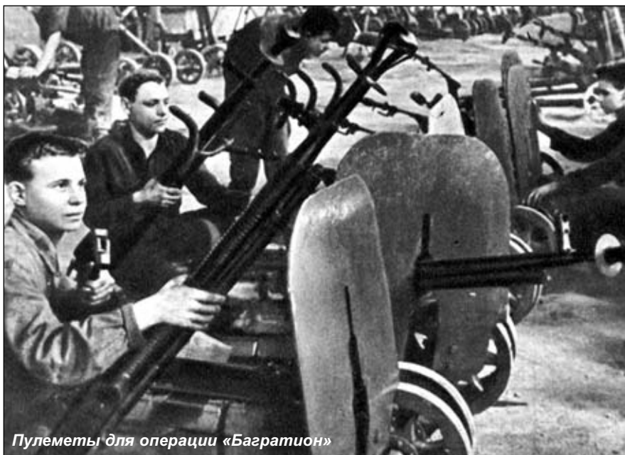
Пулеметы для операции «Багратион»

Партизаны держали в своих руках обширные зоны белорусских лесов и болот. Они пускали под откос вражеские эшелоны, уничтожали целые гарнизоны гитлеровцев, карали предателей. Более чем в двадцати районах Белоруссии продолжали действовать органы советской власти. И случайно именно в эти районы фашистами были предприняты карательные экспедиции, поголовно истреблявшие население. Но окончательно ликвидировать партизанские зоны гитлеровцам так и не удалось.