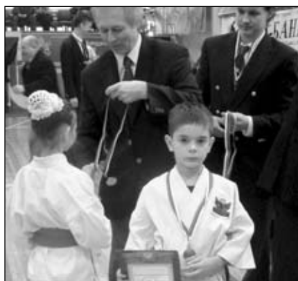
15 февраля в Москве в знаменитом Зале борьбы им. Ивана Ярыгина

на состоялся Военно-спортивный праздник и Общероссийский турнир по каратэ-до, посвященный Дню защитника Отечества.