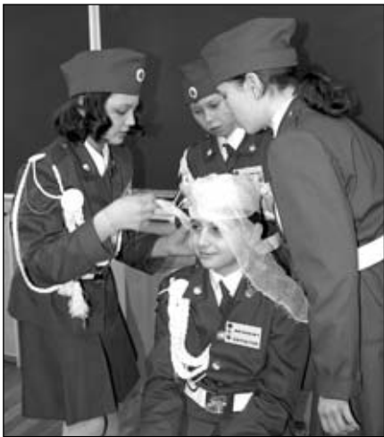
Каждый ребенок знает - перебежать дорогу на красный свет нельзя. Однако частенько дети забывают

ют об этом. И котельниковские учителя напоминают им правила дорожного движения не на скучных уроках, а во время традиционной увлекательной игры «Юные инспектора движения». В этом году она прошла 12 марта в Котельниковской школе № 3.