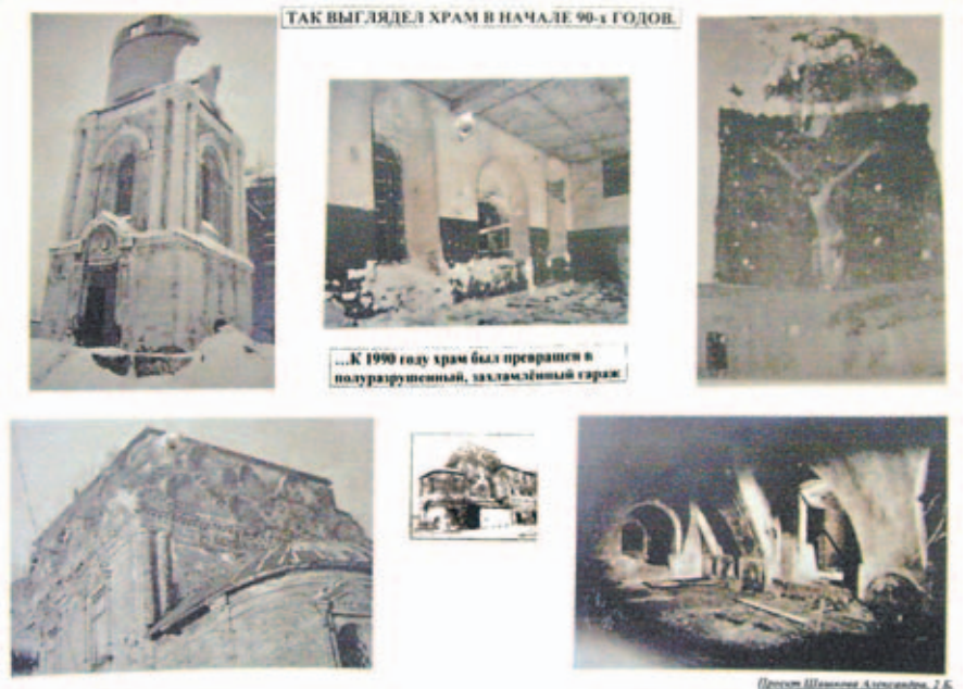
ТАК ВЫГЛЯДЕЛ ХРАМ В НАЧАЛЕ 90-х ГОДОВ.