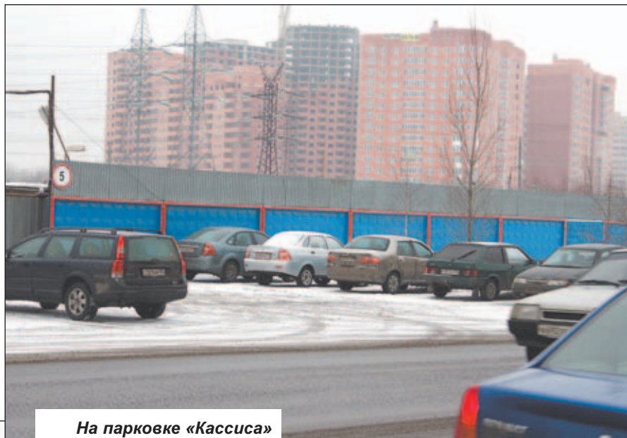
На парковке «Кассиса» полный порядок

- В ходе рейда мы пересекли два железнодорожных переезда. Что скажете об их состоянии, все ли в норме и соответствует ли существующим требованиям?