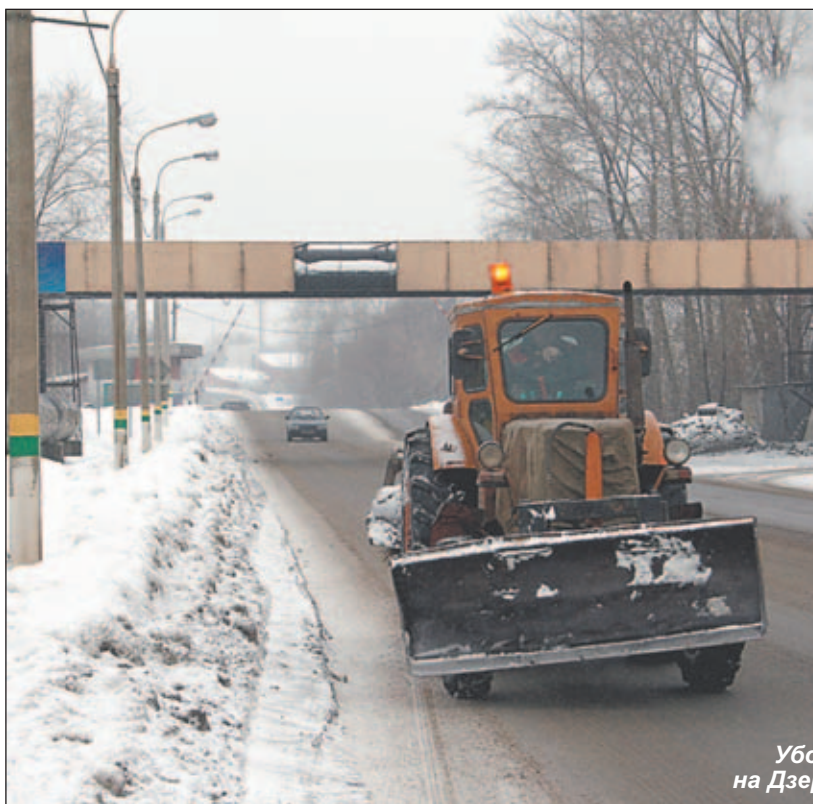
Уборочная техника на Дзержинском шоссе