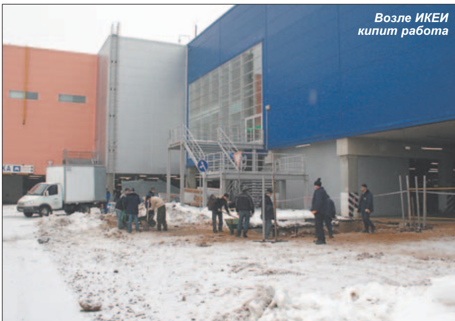
Возле ИКЕИ кипит работа

Чего не скажешь о многих других компаниях и фирмах города. Невеселые краски в котельниковские пейзажи вносят горы строительного мусора, выросшие между электроподстанцией