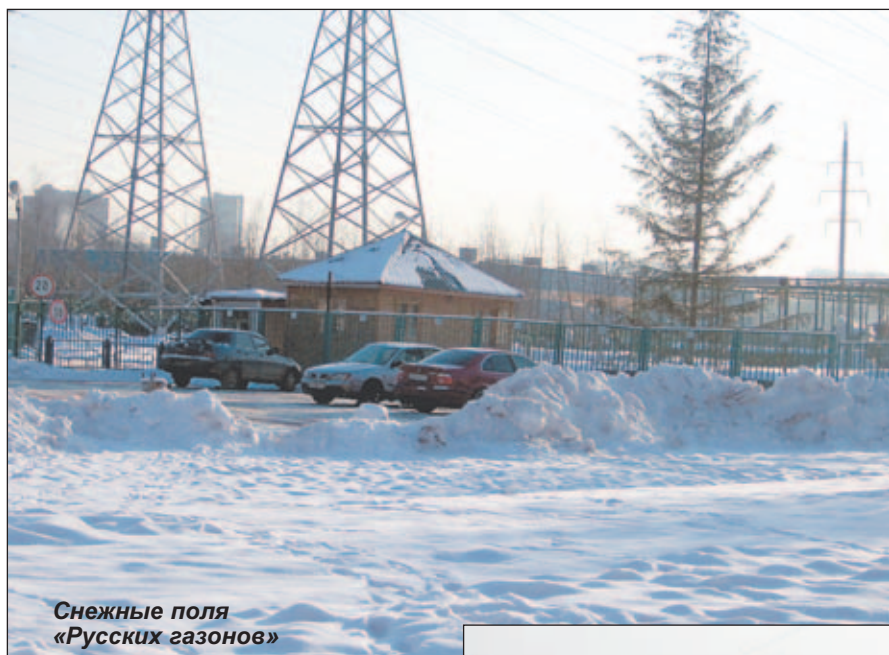
Снежные поля «Русских газонов»