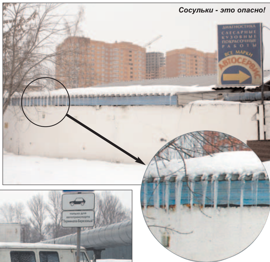
Сосульки - это опасно!

регулярных объездов по Котельникам, ежедневно обследовать территорию не менее двух фирм, а то и более. Кроме каждодневных проверок состояния чистоты, порядка, благоустройства и производства работ на территории города, службой проводятся и дополнительные сезонные мероприятия. Зимой это операция «Снегопад». Во время последней, например, проверяется кровля большепролетных нежилых зданий (жилой фонд контролируется жилищной инспекцией) и мест массового посещения людей, как то школы, спортивные учреждения, медицинские организации, торговые комплексы. Чтобы предотвратить несчастные случаи, а в памяти живы примеры обвала кровли из-за вовремя не убранного с крыши зданий больших масс снега, ежегодно фиксируются и случаи нанесения вреда людям упавшими с крыши сосульками. Поэтому, наученные горьким опытом, мы очень тщательно проверяем, счищается ли снежная корка, наледь и как часто это делается. Конечно, с современными торговыми комплексами намного проще. К примеру, гипермаркет «Реал» имеет кровлю с подогревом, и снег, падающий на крышу, мгновенно превращается в воду, которая отводится по специальным водостокам. Поэтому угроза обвала наледи там минимальная.