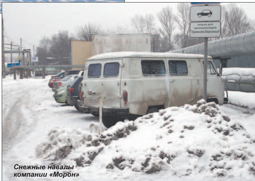
Снежные навалы компании «Морбн»

- Каждое котельниковское предприятие обязано вывозить бытовой