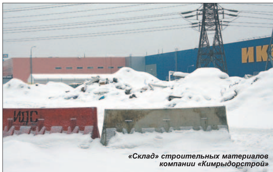
«Склад» строительных материалов компании «Кимрыдорстрой»

- Как Вы оцениваете ситуацию в сфере благоустройства Котельников?