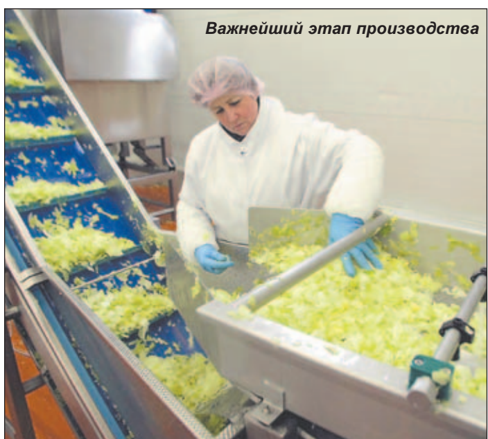
Важнейший этап производства

Место сбора - сквер перед Музеем агрофирмы - выглядит в преддверии такой экскурсии несомненно символично. Ведь все без исключения старожилы города помнят времена, когда агрофирма «Белая Дача» являлась в Котельниках, тогда еще поселке, одним из ведущих предприятий. Рабочие места - недалеко от дома, стабильная заработная плата и вполне обоснованная гордость за крепкие трудовые традиции. Через работу на агрофирме одно за другим прошли поколения многих семей. И в семейных альбомах наших горожан можно найти фотографии и бабушки, которая трудилась на ферме, и внучки-тепличницы. В сознании работников «Белой Дачи» выросшая на месте бывшей сельхозартели агрофирма была неким фундаментом, на котором надежно стоит их город. Но время идет... Какими будут фотографии, которые лягут в семейные альбомы завтра? Что происходит се-