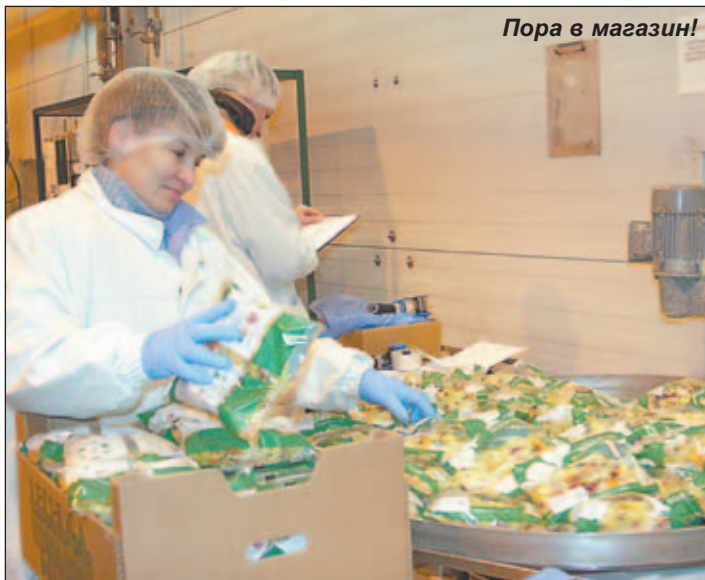
Пора в магазин!