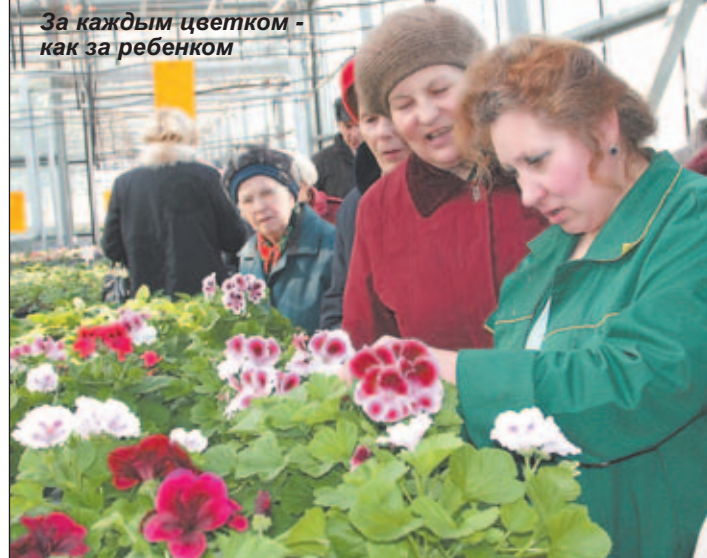
За каждым цветком - как за ребенком