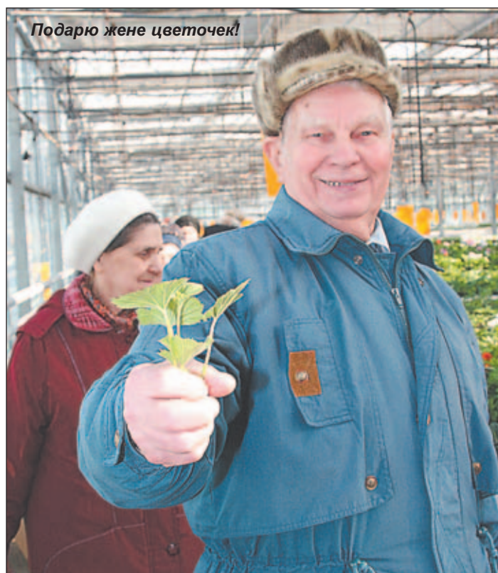
Подарю жене цветочек!