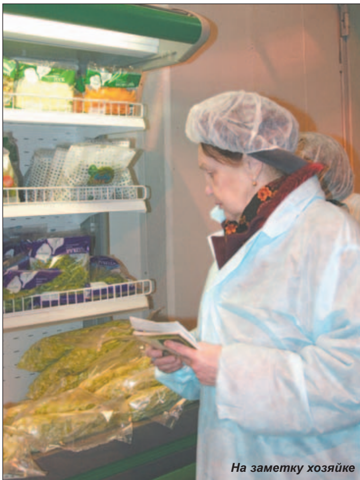
На заметку хозяйке