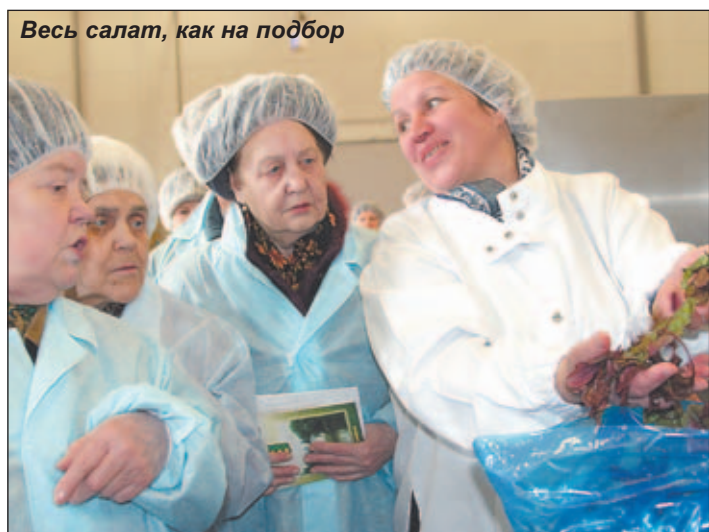
Весь салат, как на подбор

Солнечная весенняя погода, на улице тепло и ясно - отличный день, чтобы узнать что-то новое и зарядиться впечатлениями. Именно в такой день, 17 марта, состоялась экскурсия членов Котельниковского городского Совета ветеранов на предприятия Группы компаний «Белая Дача».