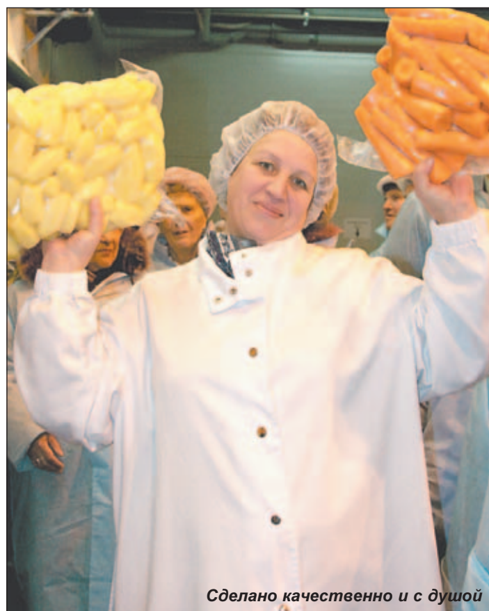
Сделано качественно и с душой

И вот первая остановка - производственная площадка компании ЗАО «Белая Дача - Трейдинг», расположившейся сегодня на территории бывшего тепличного комби-