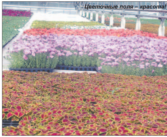
Цветочные поля - красота!

В числе видов деятельности компании - производство посадочного материала, озеленение, ландшафтный дизайн и многое другое. «Растительный» профиль компании не менее обширен: многолетние цветы, декоративные кустарники, плодово-ягодные растения... «Цветы» - крупнейший в России производитель рассады однолетних цветов, более 20 видов и 200 сортов. Современные методы и технологии, как и на «Трейддинг», - фирменный почерк. Например, техника капельного полива, используемая в теплицах предприятия. Кстати, в свое время в Котельниках о капельном поливе узнали благодаря агрофирме. И вот технология, успешно освоенная когда-то, служит новому производству. У компании «Цветы Белой Дачи» есть посадочные площади не только в Московской области, но и в других областях России, например, в Калининграде, где на площади в 40 га расположен питомник хвойных и декоративных растений.