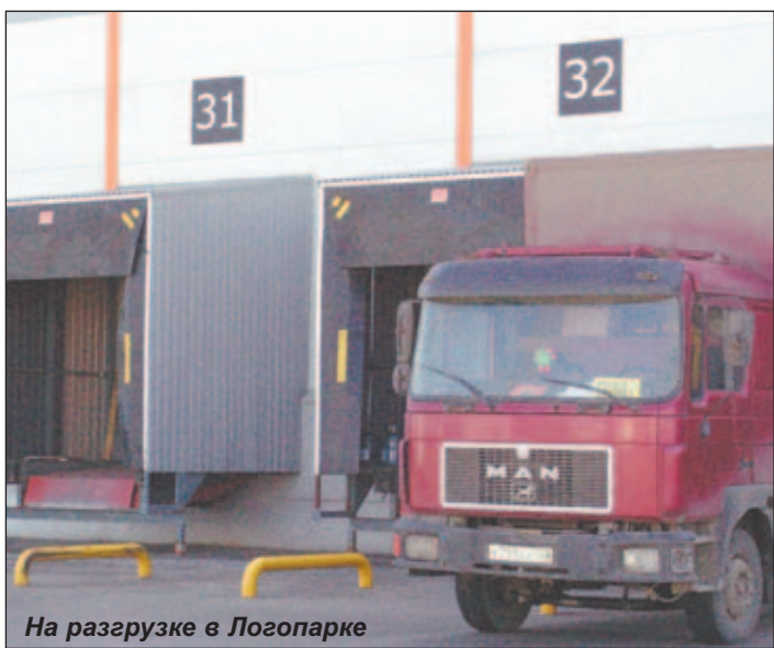
На разгрузке в Логопарке