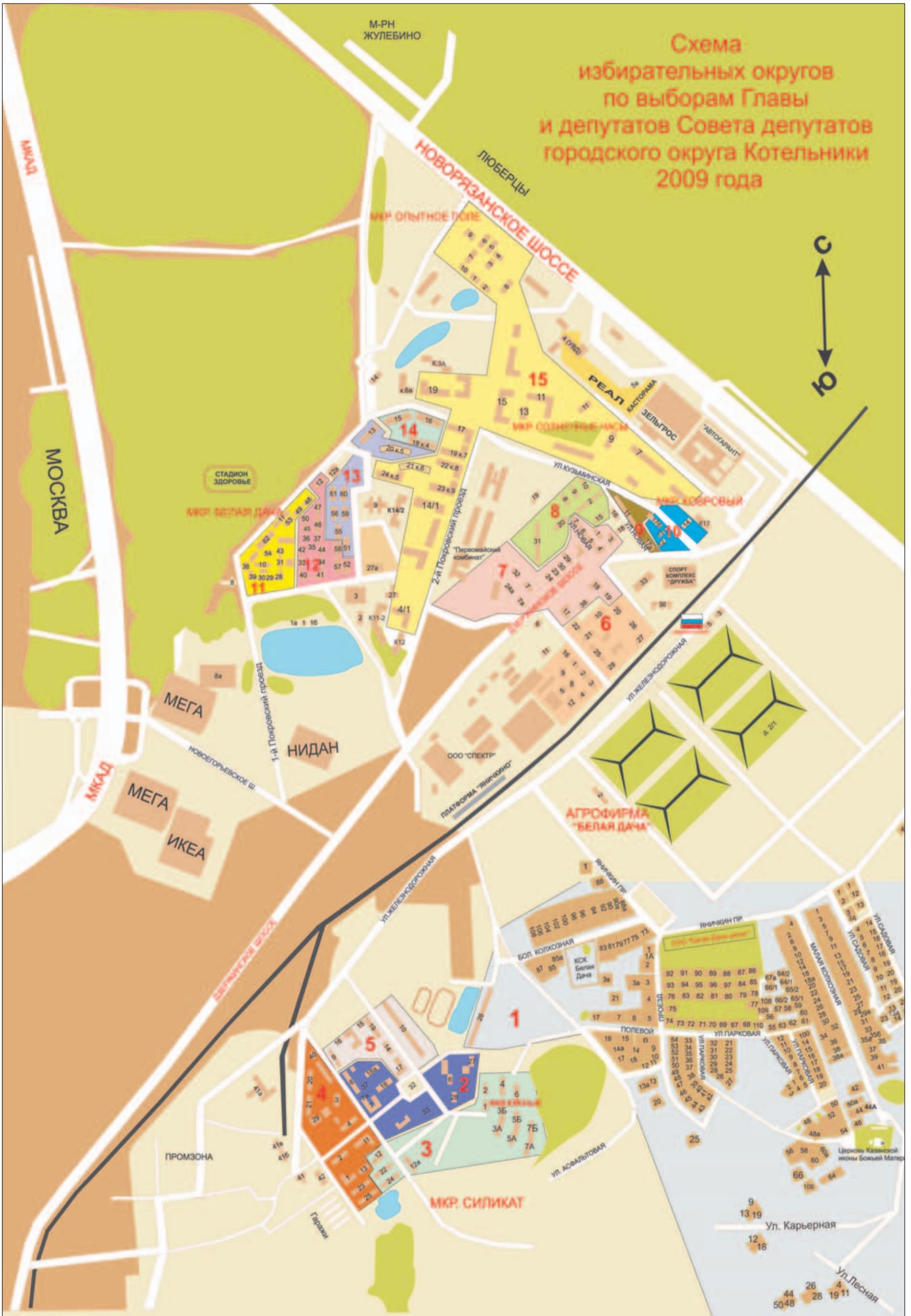
Схема избирательных округов по выборам Главы и депутатов Совета депутатов городского округа Котельники 2009 года