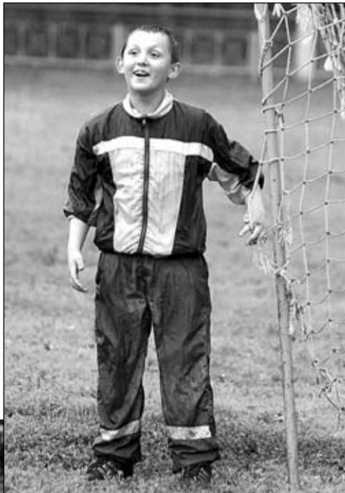
В микрорайоне «Белая Дача» 25 июня прошел ежегодный турнир дворовых футбольных команд «Кожаный мяч».

Когда я собиралась на стадион «Здоровье», выбранный в качестве места действия, погода не предвещала ничего приятного: мрачные тучи пронеслись по небу с такой скоростью, что, казалось, одна из них вот-вот «прорвется» и сразу зарядит холодный дождь. Так оно и вышло: едва подойдя к стадиону, мне пришлось открыть зонт. Немногочисленные зрители также прятались от дождя, кто как мог. Причем в ход шло все: и зонты, и дождевики, и капюшоны.