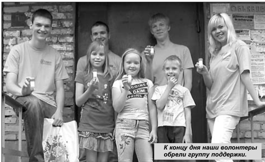
К концу дня наши волонтеры обрели группу поддержки.

Переходя от дома к дому в составе группы «исследователей», я выполнила норму по «душевному» разговорам о старинном житье-бытье, наверное, на месяцы вперед. Что касается ребят, проводивших экспертизу, то у них дела шли не так успешно: воскресенье - не самый удачный день для подобных исследований, большинство жителей находится на природе, у своих грядок на даче. Будем надеяться, что в будни им повезет больше. И мы в скором времени получим детальный отчет о проделанной ими работе.