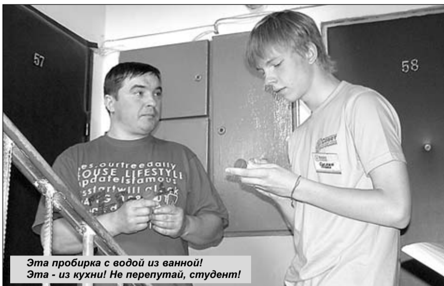
Эта пробирка с водой из ванной! Эта - из кухни! Не перепутай, студент!