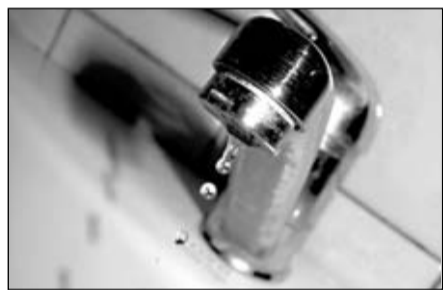
На дворе лето, а это верный признак того, что скоро в кварти-

рах горожан отключат горячую воду, чтобы подготовить инженерную инфраструктуру ЖКХ к новому отопительному сезону.