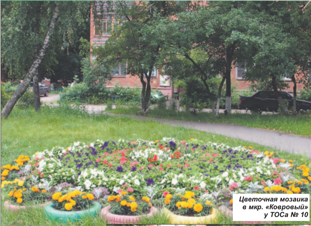
Цветочная мозаика в мкр. «Ковровый» у ТОСа № 10