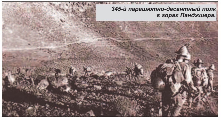
345-й парашютно-десантный полк в горах Панджшера.