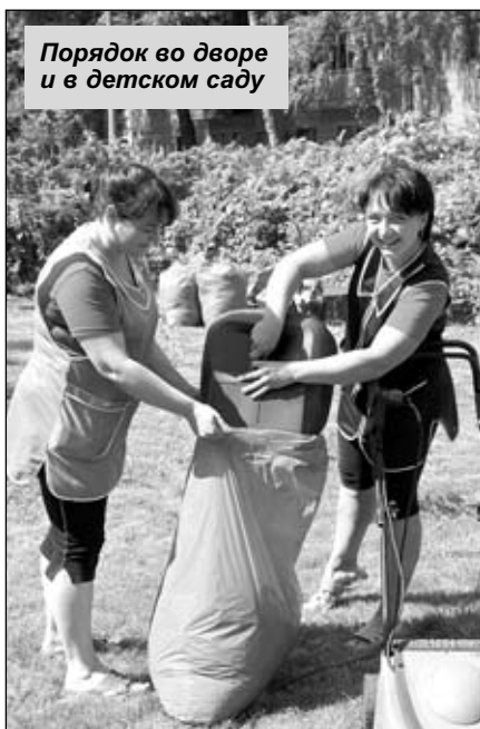
Порядок во дворе и в детском саду

Утро. Вы отводите своего малыша в детский сад. Что ему подадут на обед? Удобная ли у него постель и спокойно ли он будет спать в своей кровати? Конечно, все это безумно волнует и маму, и папу малыша. И напрасно... Детские сады города Котельники поистине становятся вторым домом для ребят, которые их посещают. А чтобы в этом убедиться, мы заглянули в каждый из них. Ведь сейчас в городских садах полным ходом идут ремонтные работы в помещениях и благоустроительные на территории.