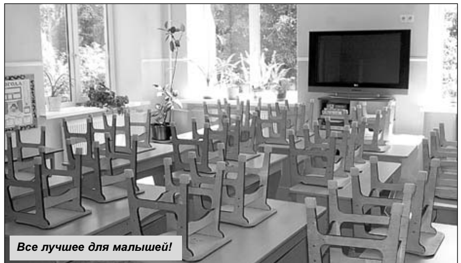
Все лучшее для малышей!

По словам директора детского сада, на все ремонтные работы был