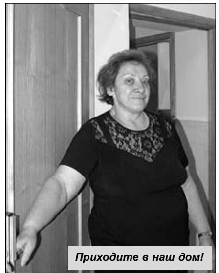
Приходите в наш дом!

Осмотрев наружную территорию сада, мы направились внутрь здания. Первое, что показала мне директор - кладовая. Помещение сверкает чистотой и словно хвастается новой «одеждой»: большущим холодильником, где хранятся продукты, небольшими шкафчиками со всевозможной посудой, аккуратными ведерками с крупами. Поднимаемся на второй этаж. Тут я не могла не оценить усилия строителей. Ступеньки лестничных пролетов сияли свежей краской, а стены - новой венецианской штукатуркой теплого бежевого оттенка. Проведя рукой по стене, я была крайне удивлена, насколько ровным и гладким оказалось покрытие. Подниматься по такому пролету - сплошное удовольствие.