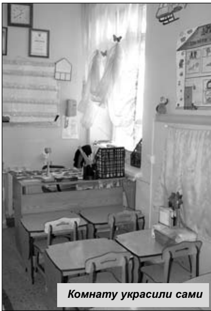
Комнату украсили сами