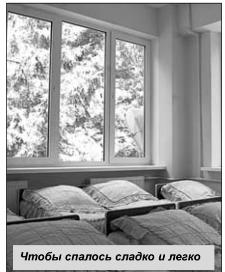
Чтобы спалось сладко и легко

Совершая маленькое путешествие вокруг детского сада, я не удержалась и заглянула на игровую площадку. Лесенки и горки, качели и карусели, словно замерли в ожидании ребят, которые вот-вот наполнят двор смехом. Кстати, здесь тоже их ожидает прият-