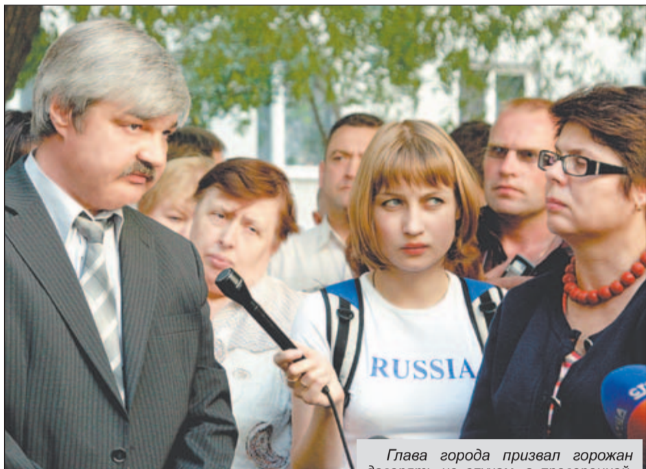
Глава города призвал горожан доверять не слухам, а проверенной, официальной информации