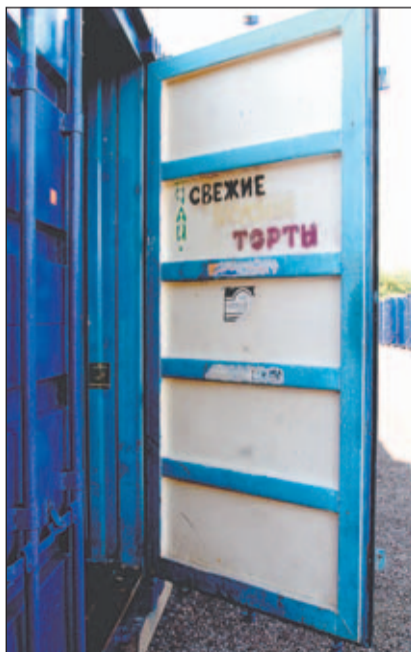
Даже одного взгляда на контейнеры, стоящие на сельхозярмарке, достаточно, чтобы понять: на вещевом рынке они отродясь не бывали!

После столь решительного заявления Алексея Седзневского напряжение во дворе явно спало, одна-