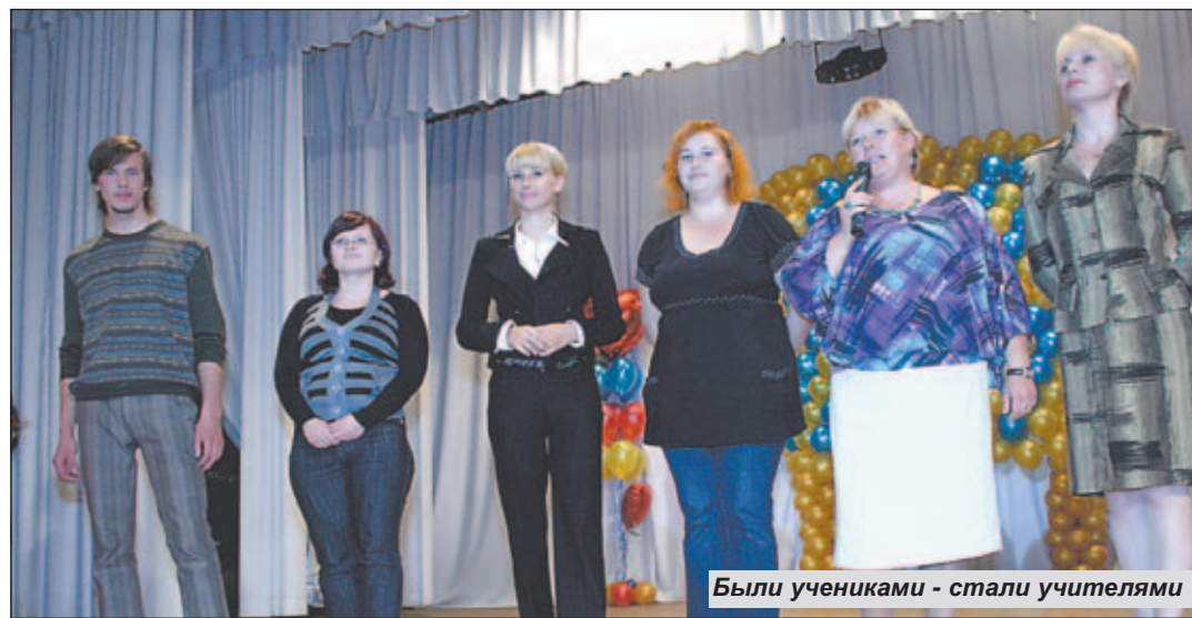
Были учениками - стали учителями

тельниковской средней общеобразовательной школой № 3». Но вне зависимости от вывески основной задачей здесь всегда видели развитие гармоничной личности. И, знаете, глядя на наших выпускников, я могу сказать, что педагогическому коллективу это отлично удавалось и удается до сих пор.