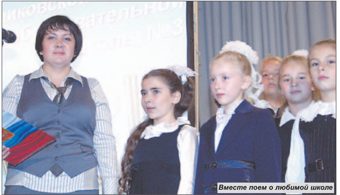
Вместе поем о любимой школе

За время своего существования школа на Белой Даче не раз меняла номер и называлась то «Восьмилетней школой № 993 Люберецкого РОНО», то «Котельниковской восьмилетней школой № 31», пока, наконец, не стала «Ко-