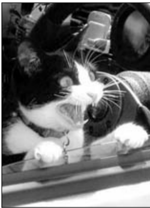
- Так, выбирай: на сливочном или на растительном?

Из компьютерной фирмы вызвали специалиста в очень крутой дом с жалобой, что компьютер сломался. Приезжает специалист и видит в правом верхнем углу монитора дымящуюся дыру. Спрашивает, в чем дело? Хозяин ему отвечает: - Я самый крутой авторитет в районе, такие стрелки разруливаю, а мне какая-то скрепка пальцем у виска крутит! Поймал мужик золотую рыбку: - Хочу маленький заводик, дом и машину. Рыбка: - Хорошо, но в кредит или по лизингу?..