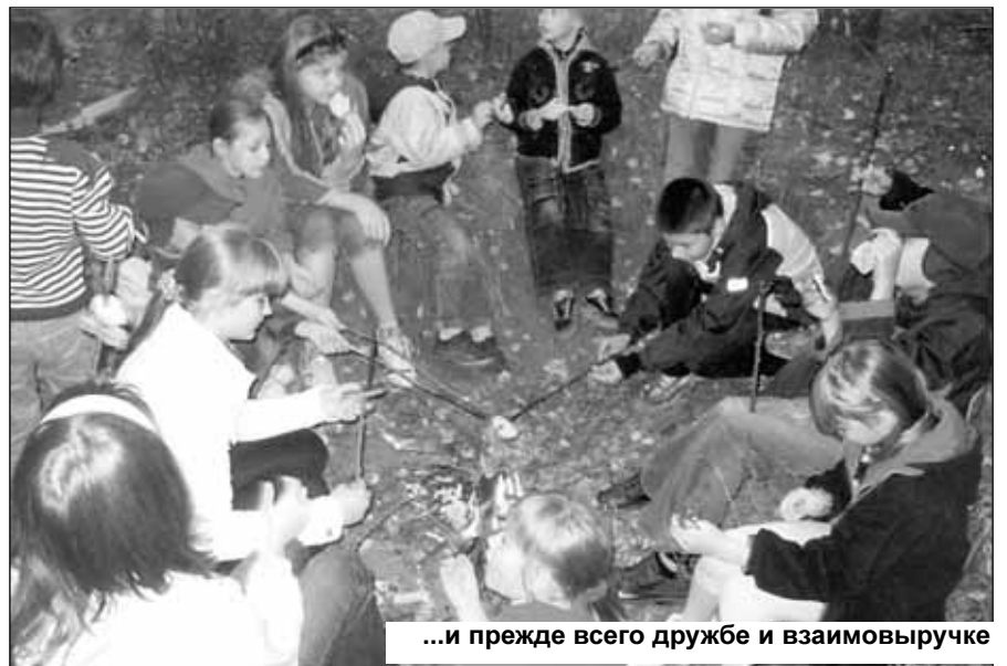
...и прежде всего дружбе и взаимовыручке