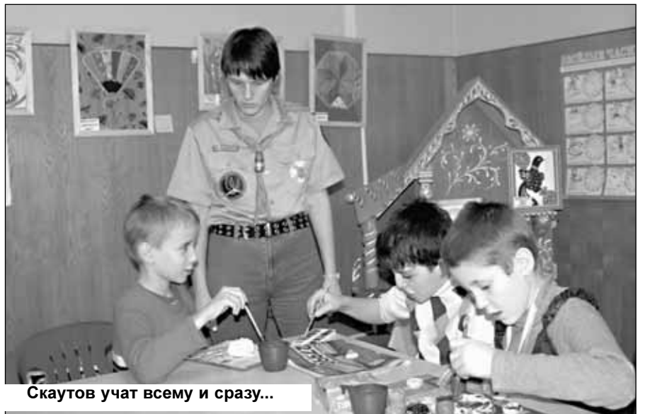
Скаутов учат всему и сразу...

Что же должен знать настоящий разведчик, кроме как выжить в лесу и оказать первую медпомощь? Историю и гимн своей организации, а также песни, без которых не обходится ни один костер. Русский язык, литературу и искусство, дабы не забывать национальную культуру и традиции. И непременно