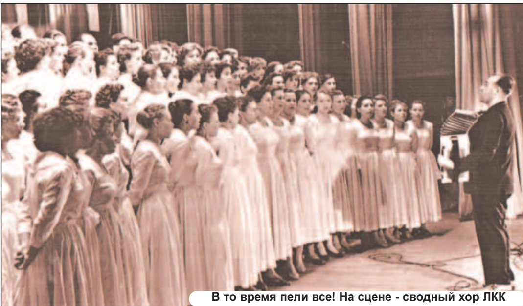
В то время пели все! На сцене - сводный хор ЛКК