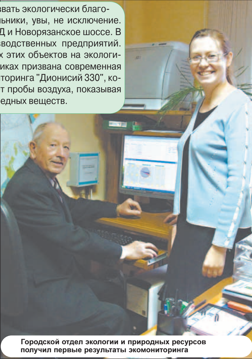
Городской отдел экологии и природных ресурсов получил первые результаты экомониторинга

Стоит отметить, что аналогичной системы нет нигде в регионе! Да что там в регионе, по всей стране городов, где функционируют приборы, ведущие экомониторинг, раз-два и обчелся! Первый датчик автоматизированной системы экомониторинга появился в нашем городе больше года назад. В порядке эксперимента он был размещен на здании городской администрации. Компактный прибор собирает немало ценной информации. Он показывает содержание в воздухе окислов азота, окислов углерода, двуокиси серы, аммиака и хлора. Даже знаний, полученных за школьной партой, достаточно, чтобы понять, что все эти вещества в высокой степени концентрации могут пагубно сказаться на здоровье горожан. Но это еще не все, на что способен "Дионисий". Он регистрирует направление и скорость ветра, атмосферное давление, влажность и температуру воздуха.