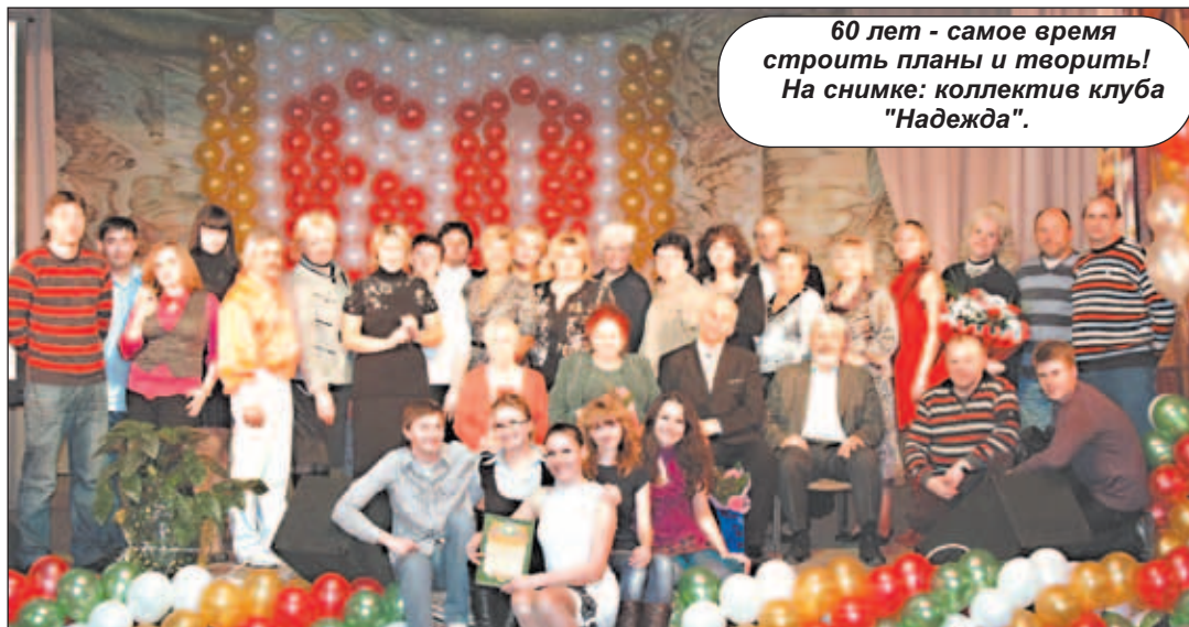
60 лет - самое время строить планы и творить! На снимке: коллектив клуба "Надежда".

4 декабря в торжественной, но тем не менее очень теплой, дружественной обстановке весь микрорайон "Ковровый" решил отметить знаменательный юбилей - 60-летие клуба "Надежда". Причем пришли в заведение культуры не только мамы и дети, но и бабушки и внуки, дедушки и папы. И праздновали они даже не юбилей, а, скорее всего, - День рождения своего любимого клуба. Потому что в таком "преклонном" возрасте обычно готовятся на заслуженный отдых, но, судя по прекрасной концертной программе и овациям, живой реакции публики на происходящее, ни коллектив, ни тем более маленькие, как, впрочем, и уже очень взрослые артисты, на пенсию не собираются. Клуб молод как никогда и полон творческих планов.