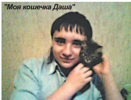
"Моя кошечка Даша"

Дорогие читатели! Недавно наша газета объявила фотоконкурс "Мой любимец". Самые активные из вас откликнулись первыми и прислали фотографии своих четвероногих друзей. Полюбуйтесь на этих совершенно очаровательных представителей семейства кошачьих! Пожалуй, каждый из них достоин высокой оценки.