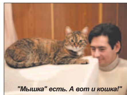
"Мышка" есть. А вот и кошка!"

Мы уверены, что у вас дома живут не только кошки, но и собаки, хомячки, попугайчики... Мы ждем фотографий ваших верных друзей! Присылайте их по электронному gazeta@kotelniki.ru или приносите лично в редакцию по адресу: мкр. "Ковровый", д.17. Конкурс продолжается! Победителей ждут призы от нашей газеты!