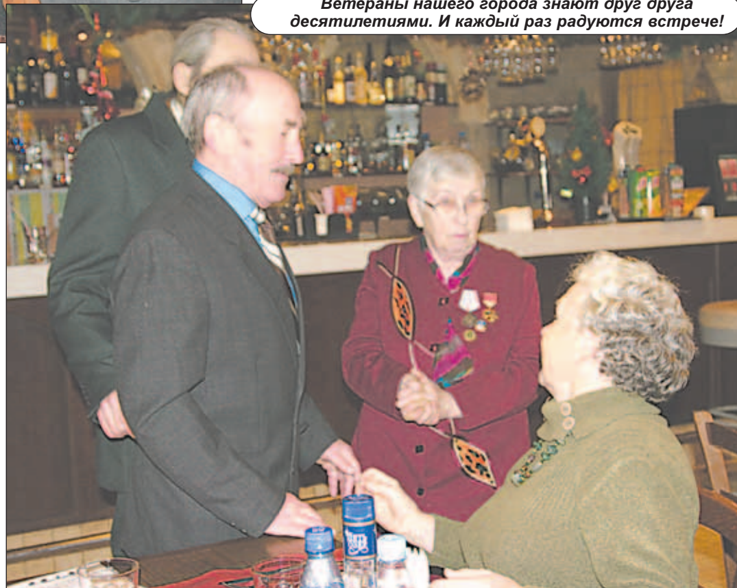
Ветераны нашего города знают друг друга десятилетиями. И каждый раз радуются встрече!

В начале декабря по всему Подмосковью широко отмечалась 68-я годовщина начала контрнаступления советских войск против немецко-фашистских захватчиков в битве под Москвой. По решению городского Совета ветеранов во всех микрорайонах Котельников в канун этой знаменательной даты были организованы встречи с ветеранами: участниками Великой Отечественной войны, тружениками тыла, вдовами погибших на той войне солдат. Седьмого декабря мы побывали на очередной такой встрече ветеранов, проживающих в микрорайоне "Опытное поле", которая прошла при поддержке ТВК "Автогарант" и компании "Солидстройгрупп".