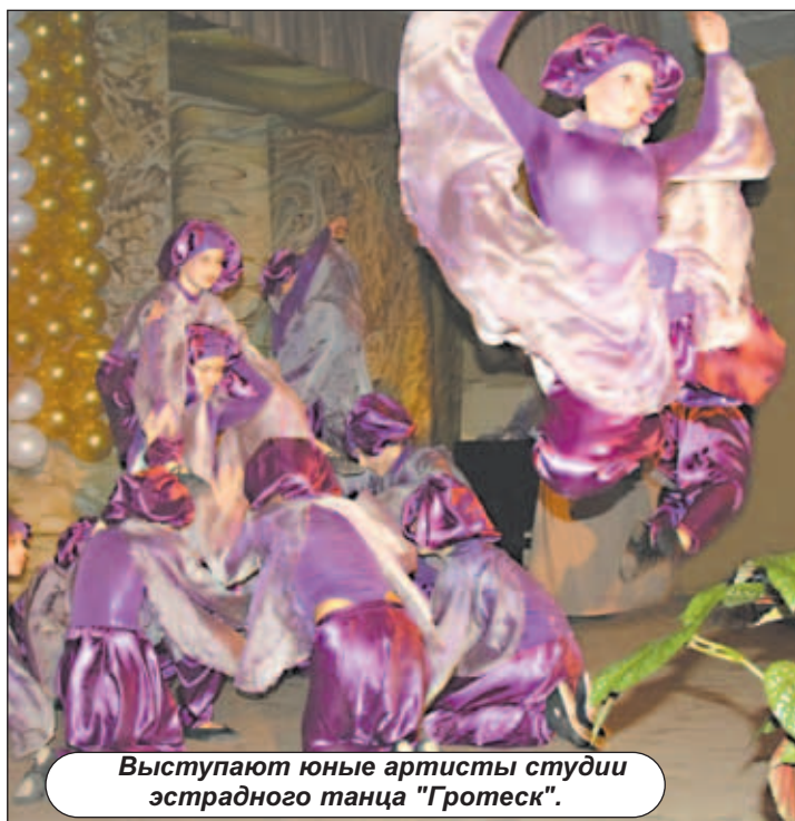
Выступают юные артисты студии эстрадного танца "Гротеск".

"...Нас учили быть творцами, и мы творили. Творили непространство, и уж непременно здесь, в этих стенах, в этих классах, на этой сцене. Играл духовой ор-