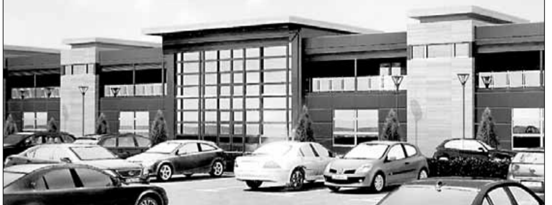
Эскизный проект торгового центра