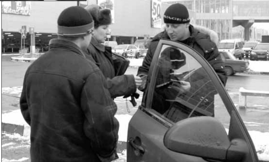
«Документы в порядке. Счастливого пути!»

Но кроме пассажиров, за тем, все ли документы в порядке у таксистов, следит административно-транспортная инспекция. Ее сотрудники почти ежедневно выходят на улицы нашего города, чтобы вы-