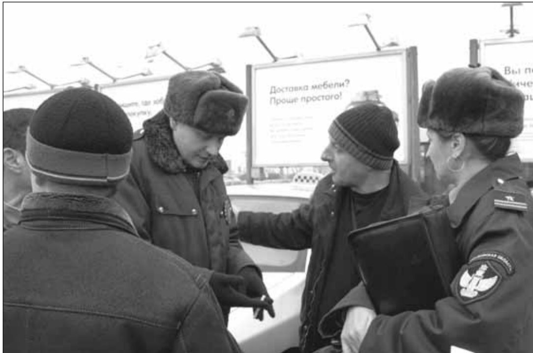
«Может, обойдемся без штрафа?»

"К такому водителю никаких претензий мы предъявить не