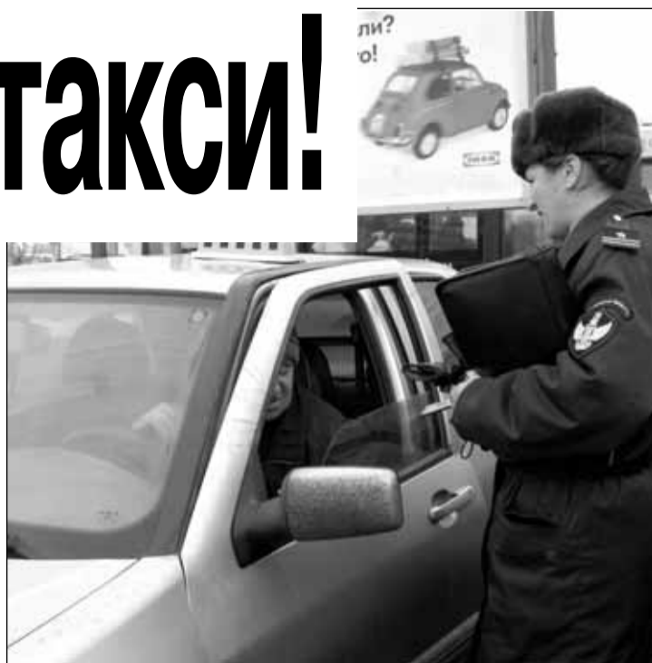
А вот и таксист-нелегал...

"Наши люди в булочную на такси не ездят!" - эта фраза, произнесенная героиней Нонны Мордюковой в фильме "Бриллиантовая рука", до сих пор не потеряла своего колорита, но вот актуальность все-таки утратила. Сейчас такси для нас - дело вполне привычное. И каждый раз, обращаясь в эту службу, всем нам хочется, чтобы поездка была комфортной, машина - чистой и исправной, а водитель - опытным и ответственным человеком, которому не страшно доверить свою жизнь.