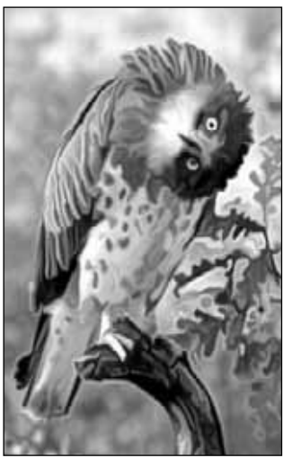
- Нет, он не лез не в своё дело.

☺ ☺ ☺ Купила пилку для ногтей, на ней написано: Lon Don Китайцы опять шифруются... ☺ ☺ ☺ Студент периодически опаздывает на лекции. Профессор раздражительно спрашивает: - Вы служили в армии? Студент: - Да. Профессор: - Ну и что говорил вам старшина, когда вы опаздывали на построение? Студент: - "Здравия желаю, товарищ лейтенант!" ☺ ☺ ☺ - Алло, здравствуйте, у вас доллары есть в продаже? - Да, пожалуйста. - А по какому курсу? - По шесть рублей. - ??? Извините, это банк? - Нет, это типография! ☺ ☺ ☺ Мужчина идет по улице в одном сапоге... Прохожие у него интересуются: - Что, голубчик, сапог потеряли? Он, гордо: - Нет, нашел! ☺ ☺ ☺ Подходит мужик к девочке, которая ест конфеты, и говорит: - Девочка, а ты знаешь, что конфеты есть вредно. Потолстеешь, зубы жёлтые будут. - А мой дедушка прожил до 106 лет. - Что, он каждый день ел конфеты?