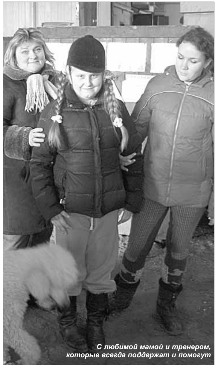
С любимой мамой и тренером, которые всегда поддержат и помогут