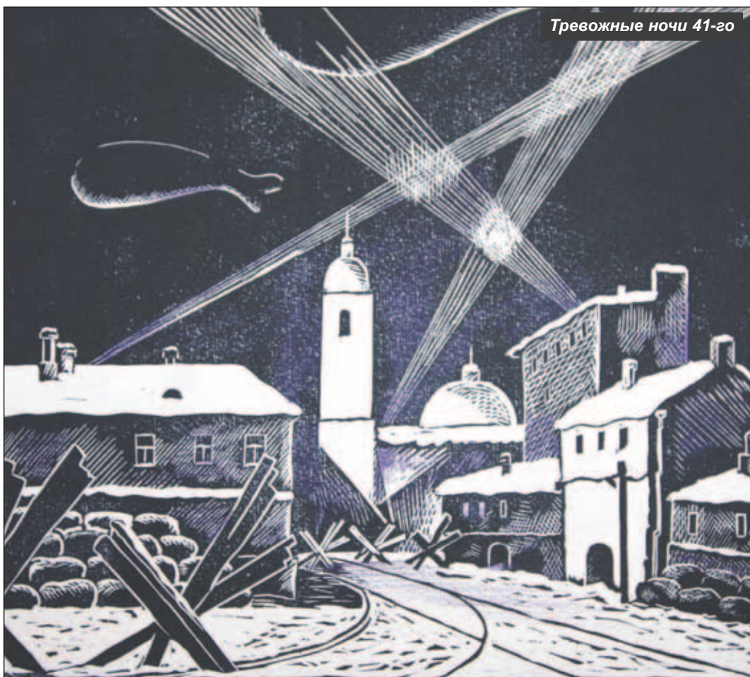
Тревожные ночи 41-го