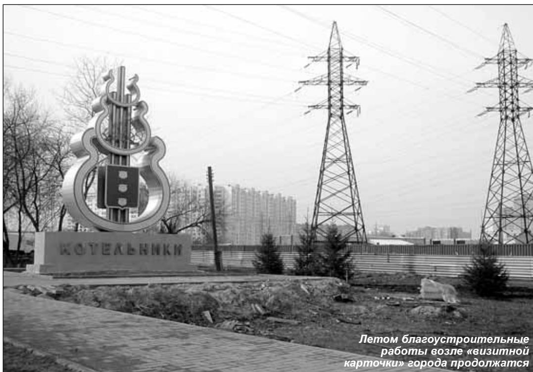
Летом благоустроительные работы возле «визитной карточки» города продолжатся