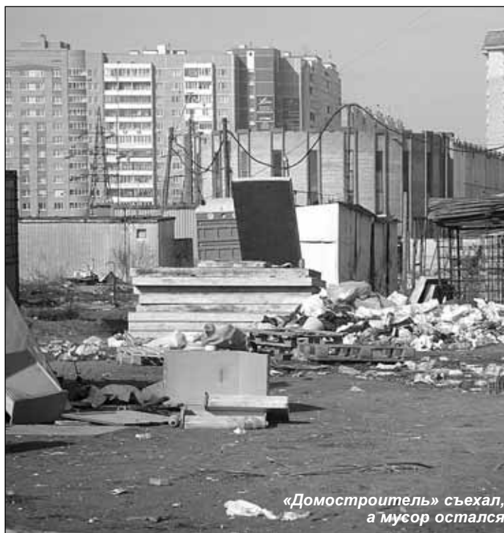
«Домостроитель» съехал, а мусор остался