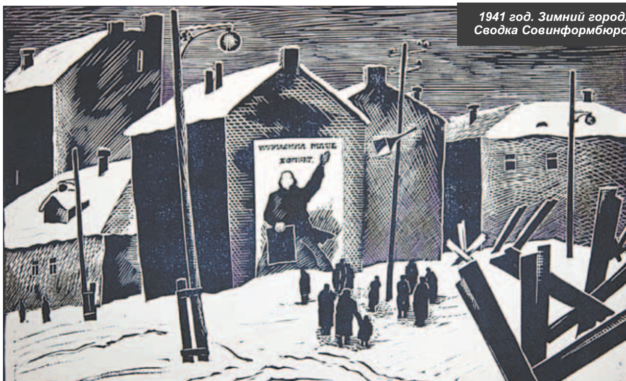
1941 год. Зимний город. Сводка Совинформбюро

Уважаемые читатели, присылайте в редакцию свои воспоминания, стихи, рисунки и фотографии, посвященные Великой Отечественной войне.