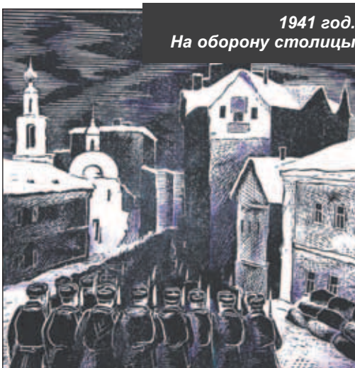
1941 год. На оборону столицы