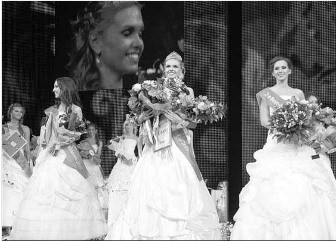
(Окончание. Начало на стр. 1)

...Первый выход красавиц. Высокие, стройные, с осиной талией, роскошными волосами, они плывут по сцене в слепящем свете прожекторов, притягивая восхищенные взгляды зрителей. Девушки движутся под музыку уверенно, грациозно - видимо, каждый жест отработан во время многочисленных репетиций. Да, им пришлось нелегко. Последние две недели они проживали в гостинице «Шелковый путь» в п. Октябрьский и тренировались чуть ли не круглосуточно. Никто не роптал. Каждая из них понимала - только трудясь, можно рассчитывать на успех.