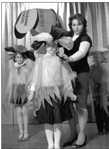
Схема проведения конкурса во многом напоминает ту, по которой проводится «Учитель года», ставший для Котельников традиционным. На первом этапе педагоги точно так же предоставляют методические материалы, в которых они должны рассказать о собственном опыте классного руководства, успехах и достижениях в педагогической деятельности.

В апреле в нашем городе прошел конкурс «Лучший классный руководитель 2010 года». В нем приняли участие самые талантливые, добрые и отзывчивые педагоги, одним словом - самые классные классные.