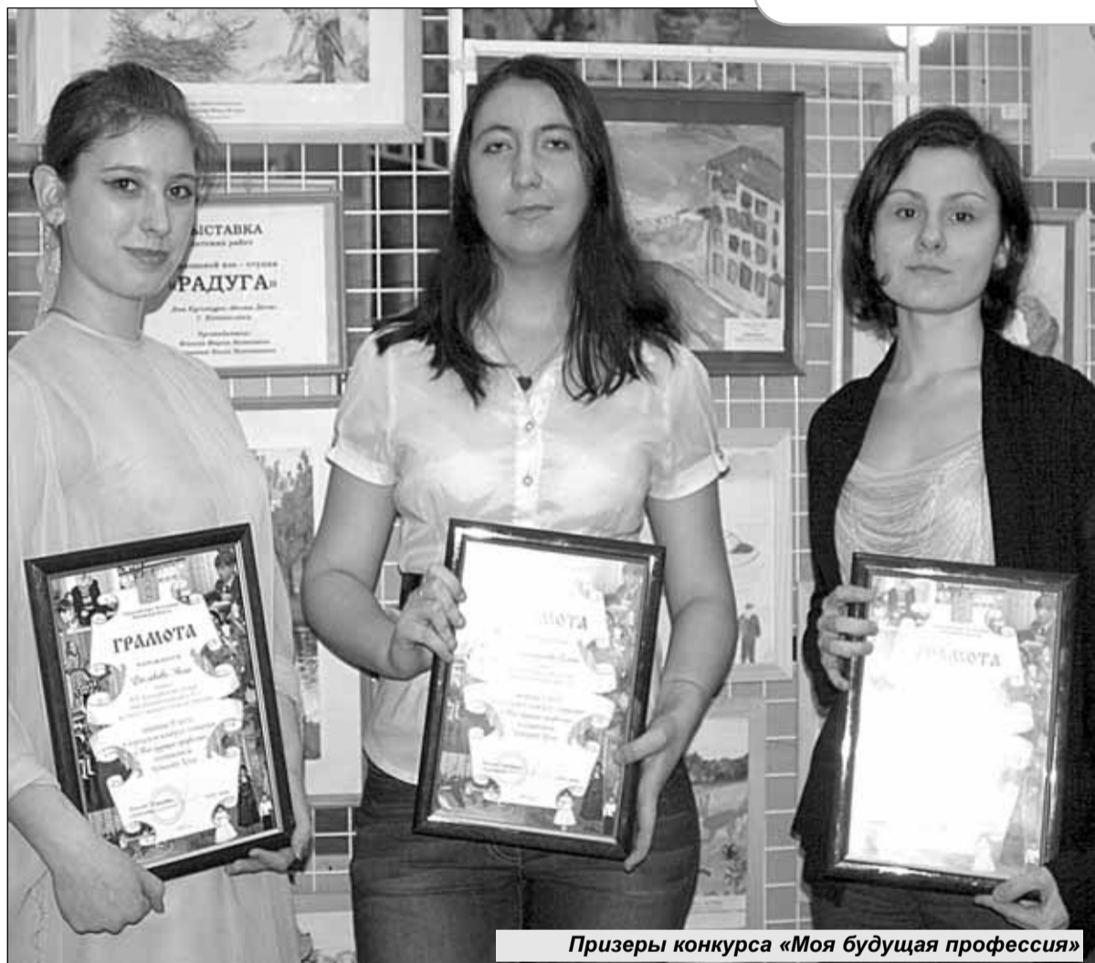
Призеры конкурса «Моя будущая профессия»

Ученые считают, что мечты каждого ребенка о своей будущей жизни начинаются с воображаемого выбора профессии. В игре, наблюдениях за взрослыми, в их разговорах и даже в любимых мультфильмах и сериалах еще детьми мы находим своих кумиров, и всю оставшуюся жизнь эти придуманные нами герои подсознательно руководят нашими поступками. В том числе и в выборе профессии. Накануне Дня труда при поддержке Управления образования администрации Котельников в детских садах и школах города прошли конкурсы рисунков и сочинений, посвященные профессиональному выбору. Отрывки из литературных работ - призеров конкурса «Моя будущая профессия» мы публикуем сегодня.