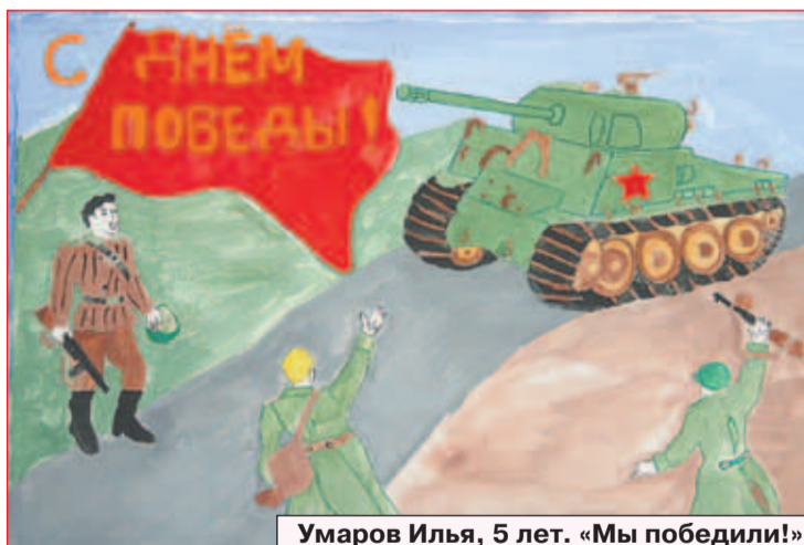
Умаров Илья, 5 лет. «Мы победили!»