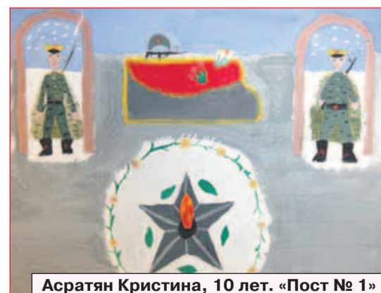
Асратян Кристина, 10 лет. «Пост № 1»