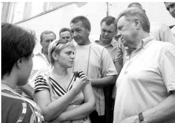
На встрече с пострадавшими жителями в Белоомуте

С 10 по 11 августа на территории Московской области ликвидирован 21 очаг природных пожаров на общей площади 67 га, в т.ч. 9 торфяных на площади 8 га и 12 лесных на площади 59 га.