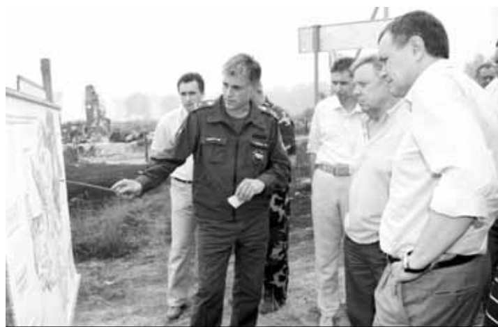
На экстренном совещании в Луховицком районе

Предваряя Ваш вопрос, скажу, что в развитие Указа Президента России я подписал Постановление, согласно которому с 3 августа до 15 сентября у нас действует режим чрезвычайной ситуации для органов управления и сил Московской областной системы предупреждения и ликвидации чрезвычайных ситуаций. Зонами чрезвычайной ситуации определены территории Воскресенского, Дмитровского, Егорьевского, Клинского, Коломенского, Луховицкого, Ногинского, Оре-