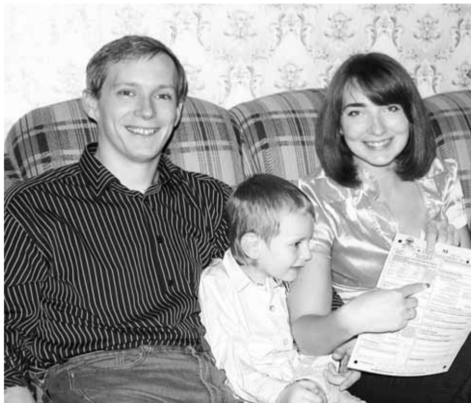
(Окончание. Начало на стр. 1)

Как мы выяснили, в Москве женщина уже давно - десять лет, много работала, смогла получить здесь высшее образование, стала гражданкой России. «Я здесь с восемнадцати лет и привыкла к жизни в большом городе. Но, что уж тут делать, пока поживу с любимой дочкой, а потом, когда ребенку нужно будет поступать в школу, вернусь с нею сюда. В школу же ее возьмут?» Мы дружно ответили утвердительно.