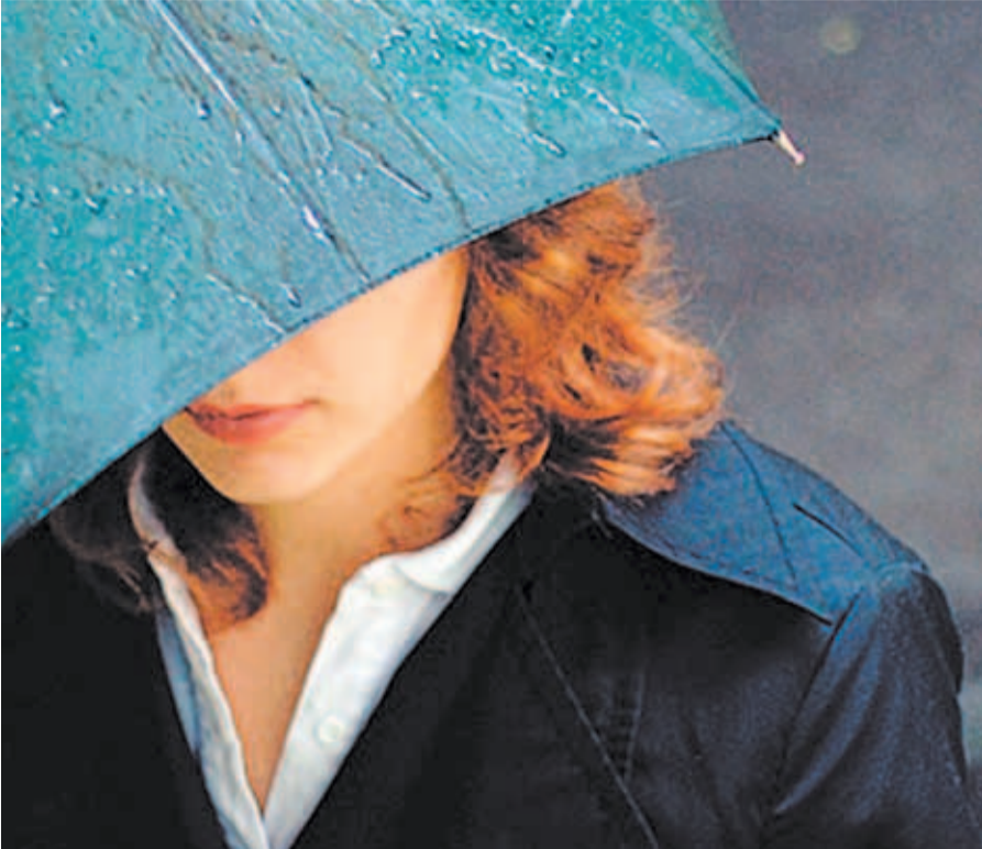
Когда погода негодует: на улице идет дождь и о солнце напоминают лишь летние фотографии...