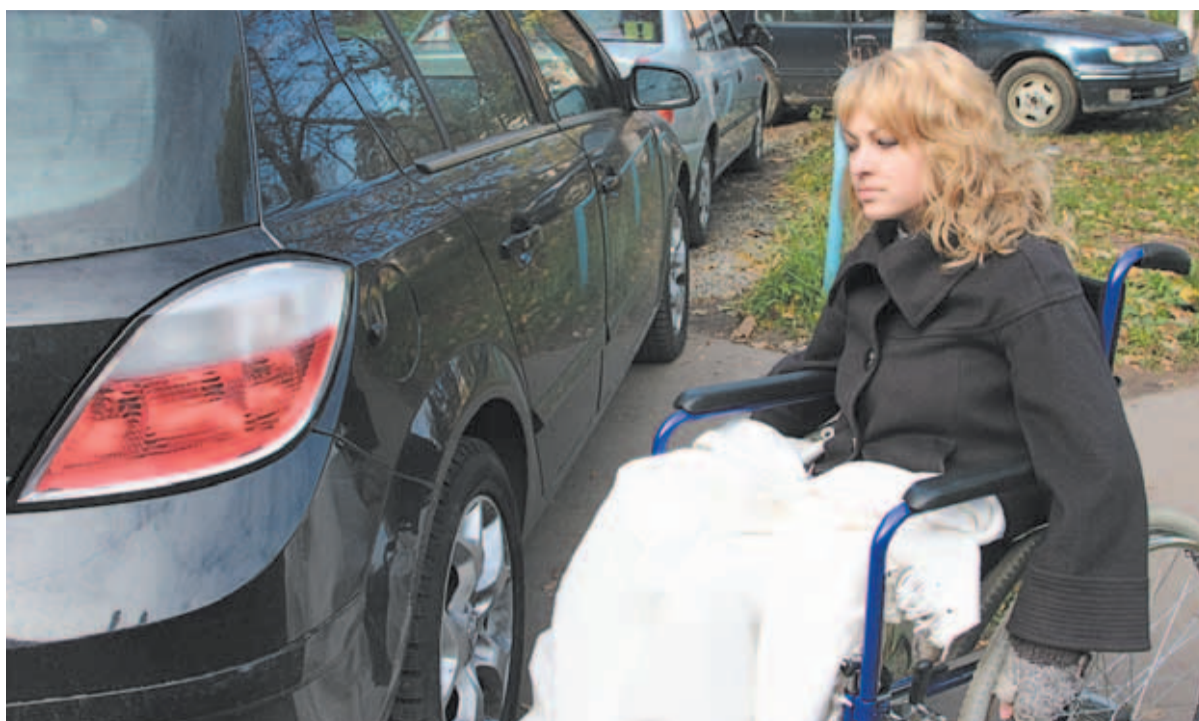
Прогулка по городу для инвалида-колясочника - настоящее испытание