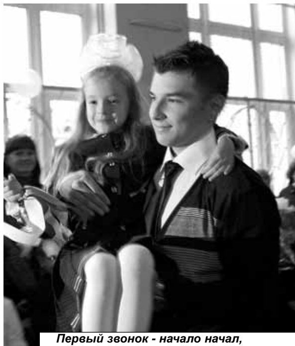
Первый звонок - начало начал, Школа - первый причал.