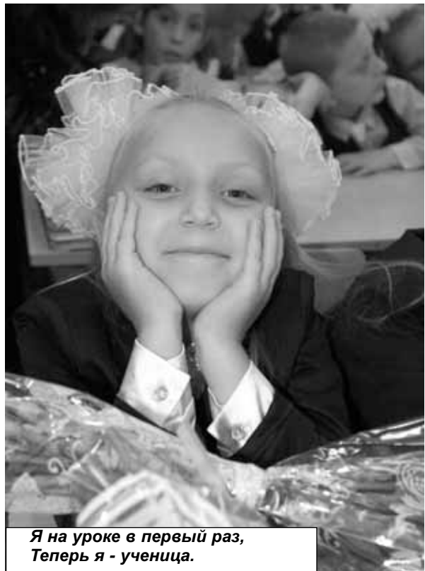
Я на уроке в первый раз, Теперь я - ученица.