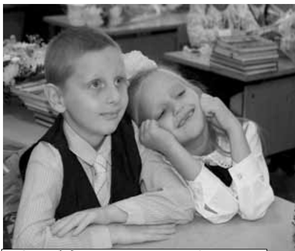
А мы будем вместе учиться!