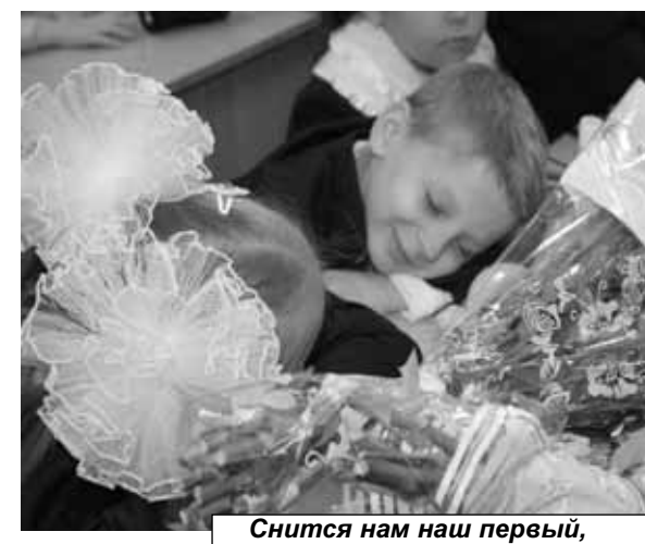
Снится нам наш первый, замечательный урок...