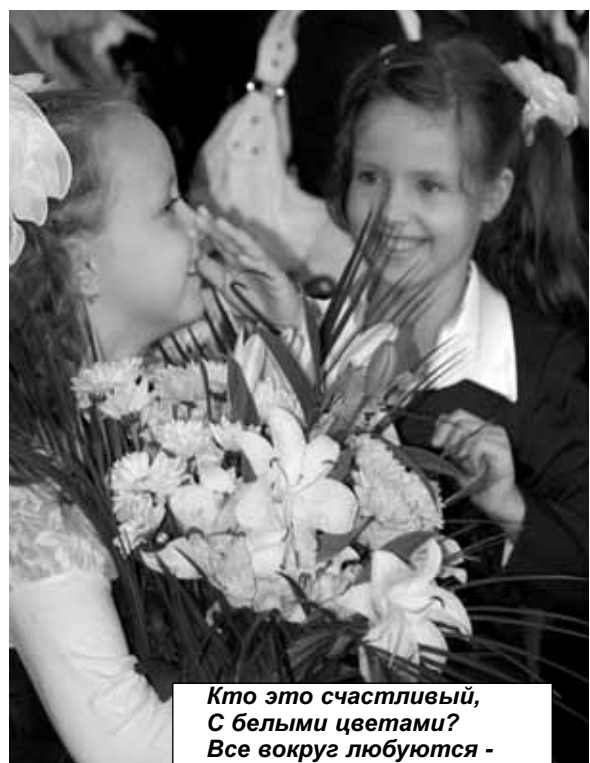
Кто это счастливый, С белыми цветами? Все вокруг любуются - Это - первоклашка!