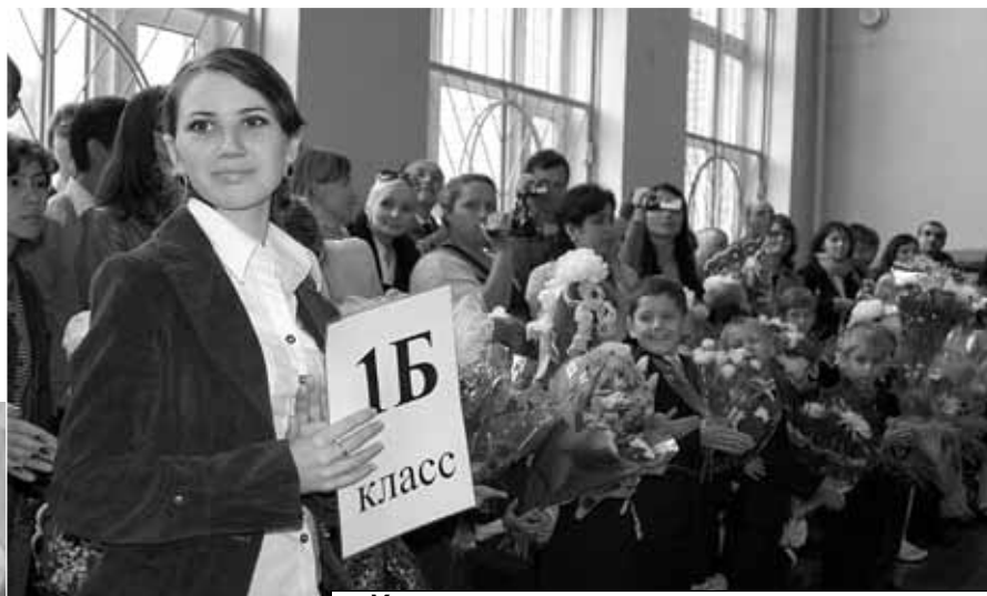
Учительница первая моя ... Ты вместе с нами поступила в школу.