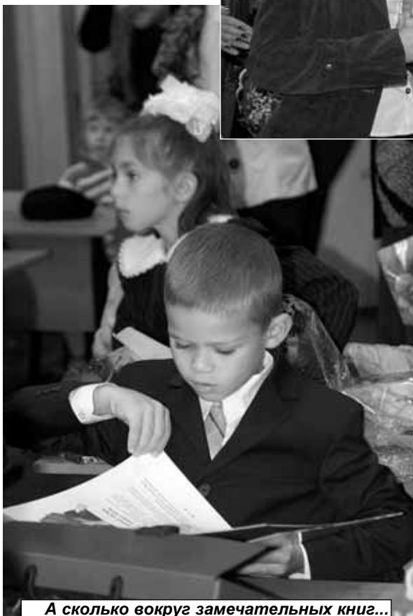
А сколько вокруг замечательных книг... Великое дело - учиться!..