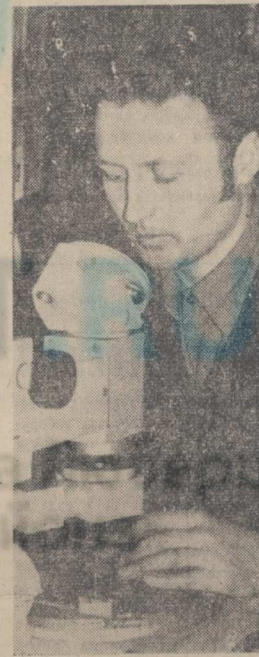
XXV съезда партии.

Как председатель цехового комитета профсоюза В. В. Колчин полагает личный пример выполнения социалистических обязательств, принятых коллективом в ответ на решения