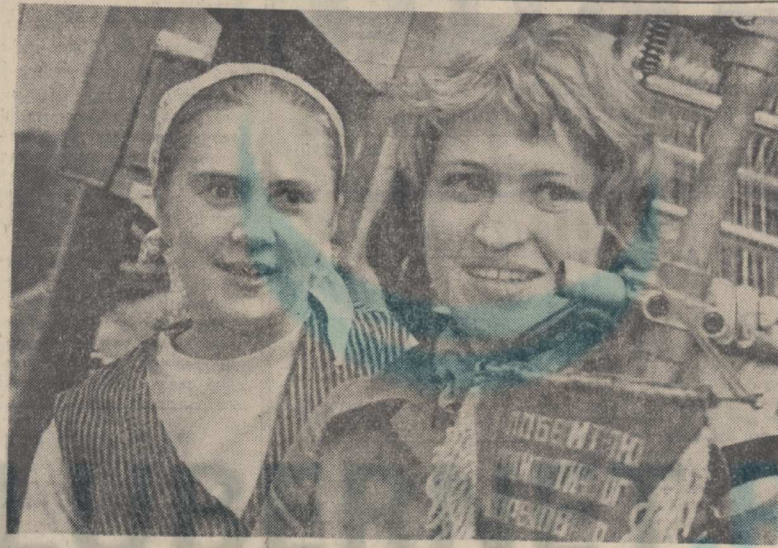
ИДЕТ ВСЕСОЮЗНОЕ КОМСОМОЛЬСКОЕ СОБРАНИЕ — «РЕШЕНИЯ XXV СЪЕЗДА КПСС ВЫПОЛНИМ!»