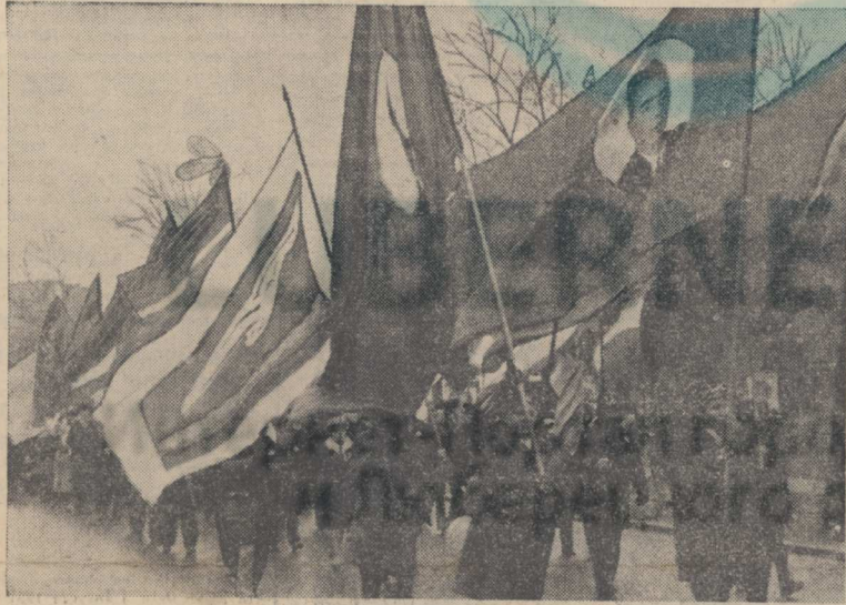
Люберчане на первомайской демонстрации.