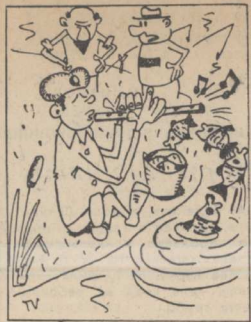
— А по-моему, надо сообщить в милицию. Рис. В. Тюленева.